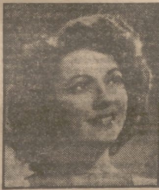
MARIA ANTONIETA PONS

La Empresa del teatro Madrid ha contratado a María Antonieta Pons; es decir, a una de las artistas más caras de hoy. Sólo actuará doce días. Porque María Antonieta nunca actúa, nunca puede actuar largas temporadas porque se lo impiden sus contratos de cine. Sólo doce días, lector, para admirar a la reina del baile cubano, al terremoto antillano, a la más grande de las artistas que hoy interpretan en escena el ritmo auténtico de los bailes afrocaribanos.