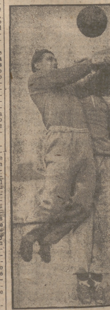
Estos tres jugadores que se entrenan en Londres, pertenecen al equipo inglés que se enfrentó al de Inglaterra. Los tres son hermanos, los célebres Knut y Bertil.