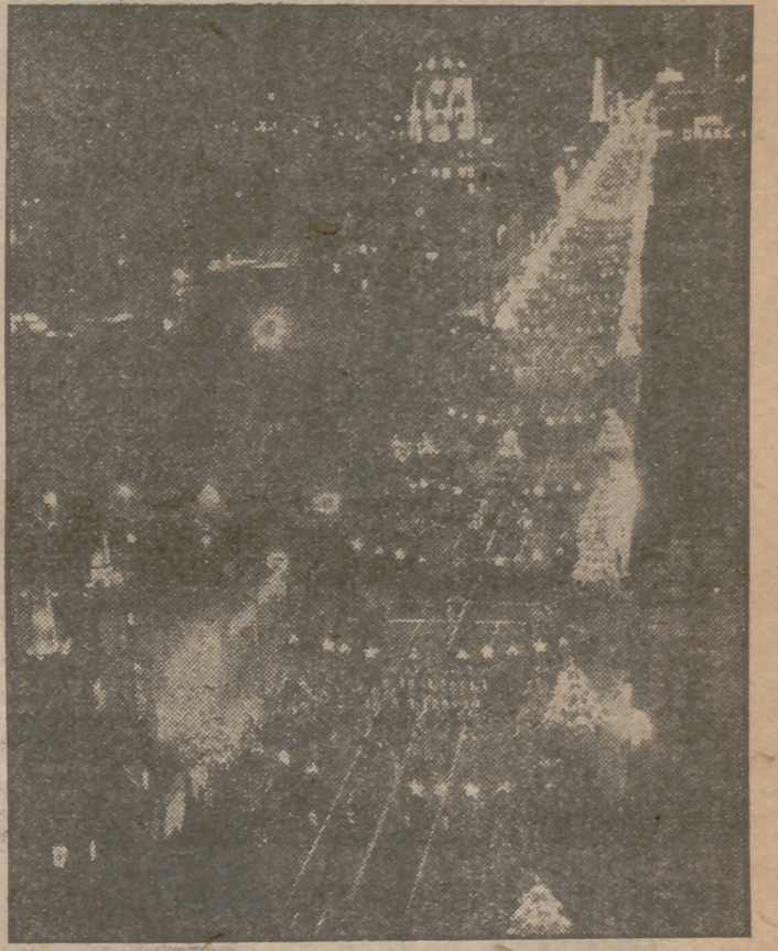
El bulevar de Hollywood arde en mil luminarias con motivo de la llegada de Santa Claus, maravilla de los pequeños y consuelo de los mayores. Los árboles de Noel forman masas fantásticas en la avenida que resume la alegría de la población.

HOLLYWOOD. (De la North American Newspaper Alliance, Especial para PUEBLO.)—Hollywood Boulevard está ya engalanado—una vez más—con el esplendoroso ropel de Navidad, y Santa Claus recorre la famosa vía en su trineo, motorizado, como corresponde a la época atómica en que hemos entrado.