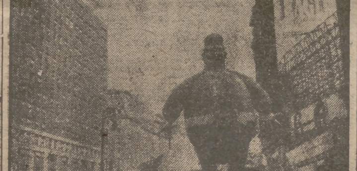
En el Broadway neoyorquino se detuvo la circulación para dar paso a una mascarada de las muchachas que invadieron las calles en celebración del día de gracias, el 27.