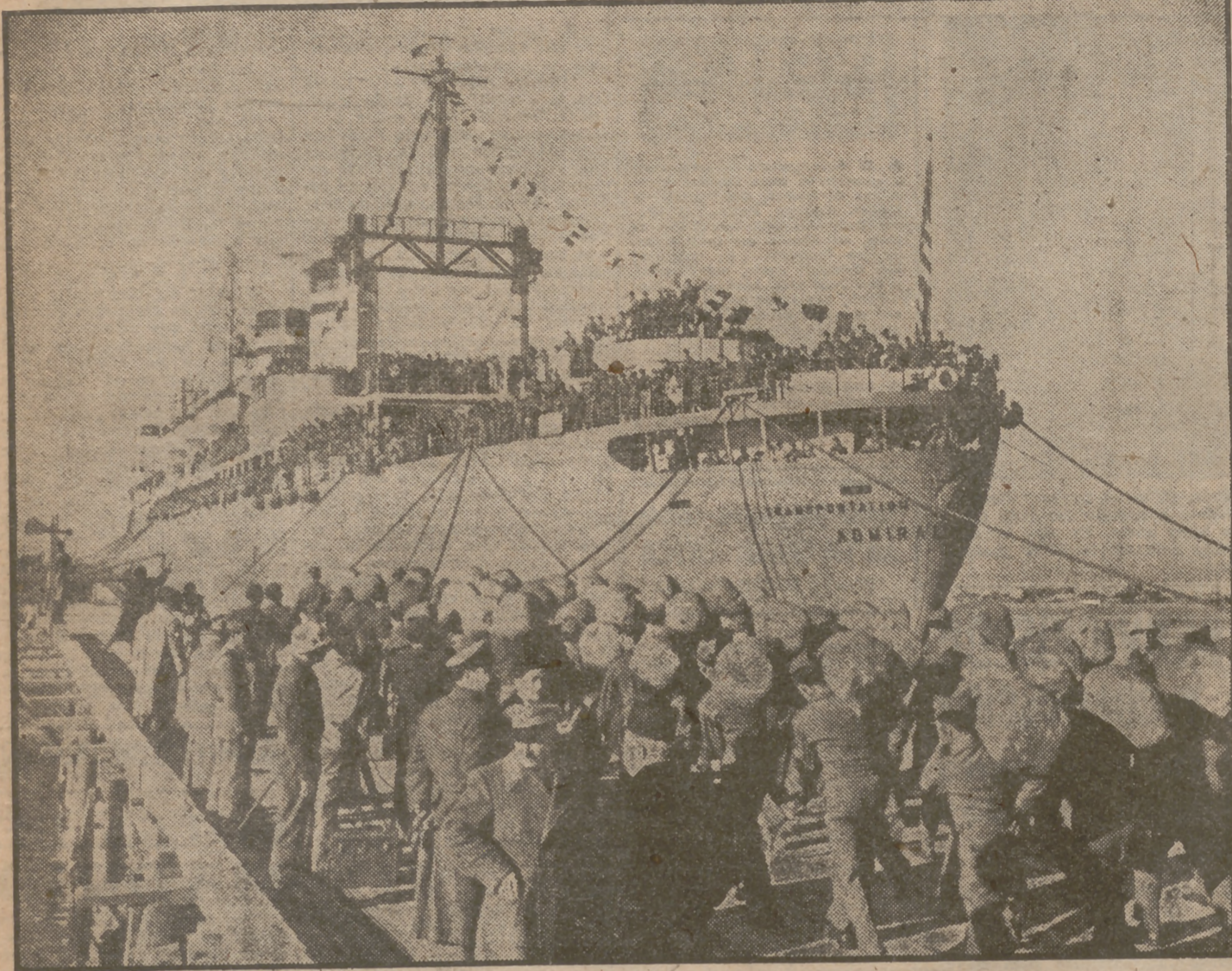
Las últimas fuerzas americanas de ocupación se van de Italia a bordo del "Admiral Sims", cumpliéndose así lo estipulado en el Tratado de paz. Lleva este buque 1.356 soldados y 97 oficiales. Ellos se van... y los comunistas acechan. ¿Pondrán inmediatamente en práctica el plan de ocupación del país? Ahora se verá. De todos es sabido que el comunismo, constante agitador, pero siempre cobarde, prefiere que los hombres armados se vayan de cualquier sitio donde el Kremlin haya ordenado operar.