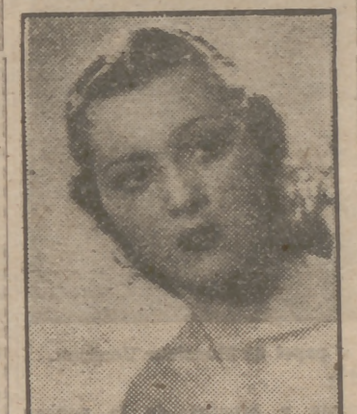
Paquita Rico, estrella de la canción.

El elenco de "Pasodoble 1947-48" cuenta, además de los notables elementos mencionados, la aplaudida cantante Juanita Azores, el buen cantor Man-