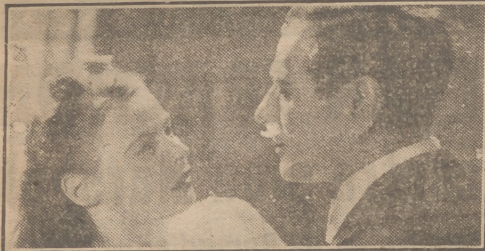
Ingrid Bergman, la figura más destacada del séptimo arte, junto al excelente actor Edvin Adolphson, en una escena de "Destino", una de las mejores películas de la sin par Ingrid cuyo estreno tendrá efecto mañana, jueves, en la pantalla de los acontecimientos cinematográficos, en el Palacio de la Prensa.