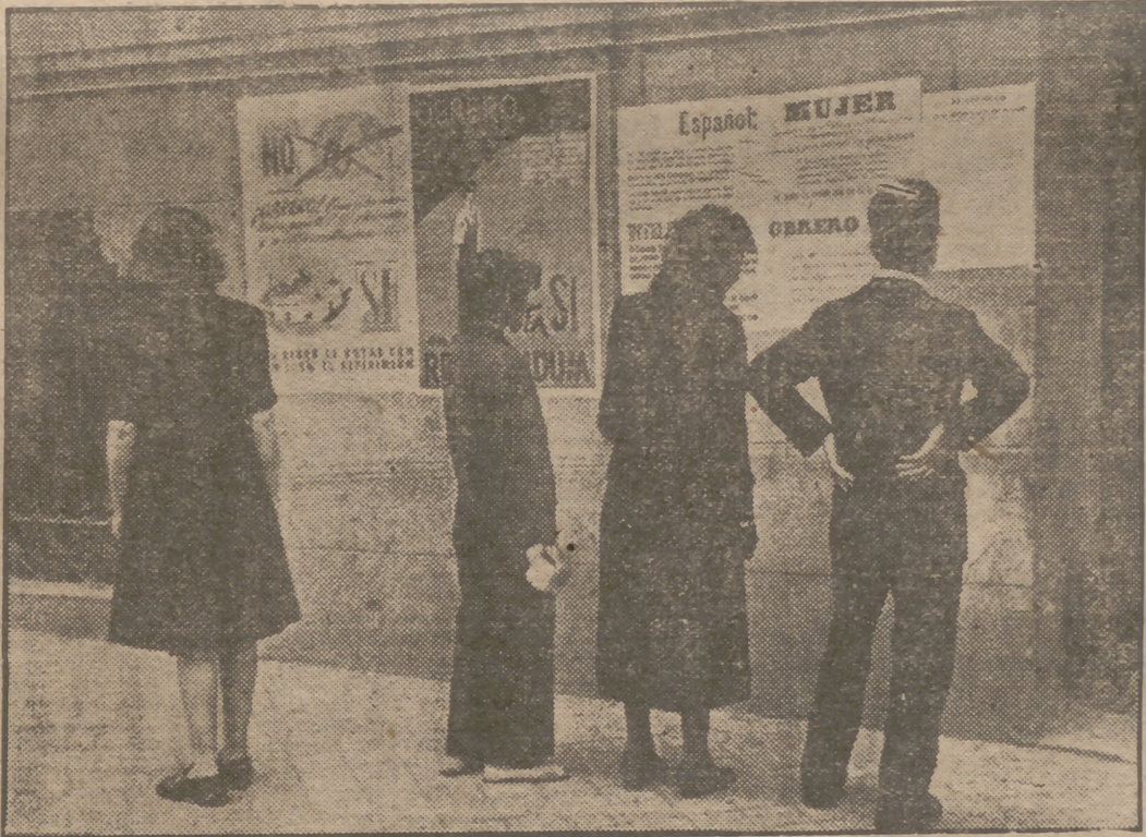
El público, cada momento más interesado por el referéndum del próximo domingo, lee los carteles, pasquines pegados en las fachadas de los edificios madrileños, para conocer los detalles de la votación.

El marqués de la Valdavia, presidente de la Diputación de Madrid, contesta así a nuestras preguntas: —El día 6 de julio, España, en un clamoroso "SI", dirá que está con Franco. Estoy seguro que este "SI" será rotundo, porque los españoles tienen la virtud de ser agradecidos y desean ratificar su voluntad decidida de que la Patria siga avanzando por las rutas de la prosperidad y de la justicia social, que ha de dar a todo español aquello a que humana y cristianamente es acreedor. Pero además esta afirmación contundente significará que aquel trágico período de la revolución marxista no volverá a repetirse. Votar "SI"