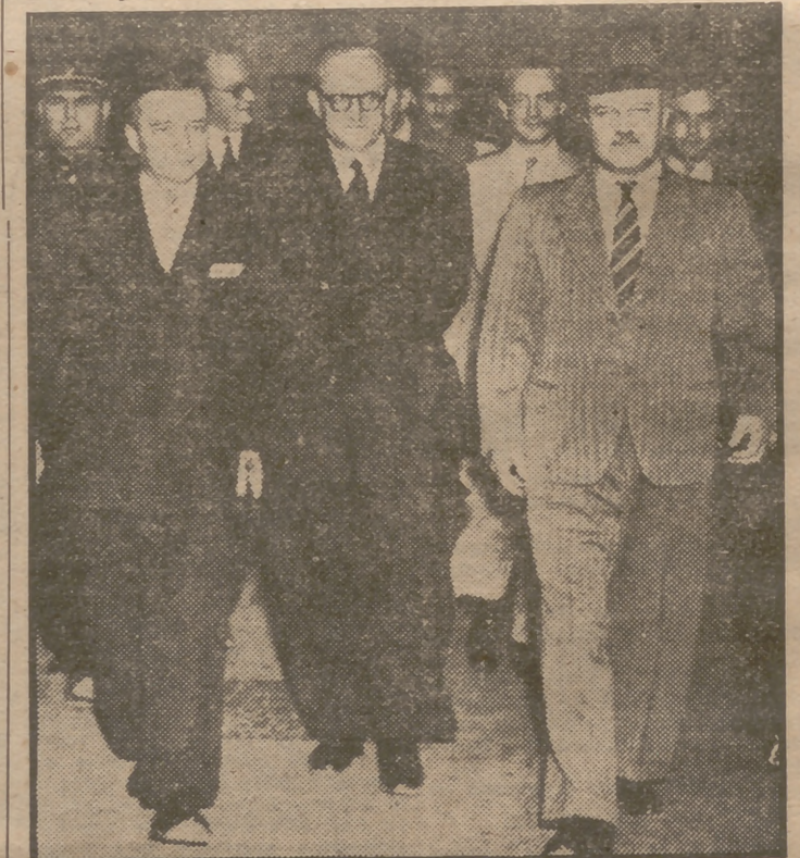
El ministro de Asuntos Exteriores soviético, Molotov (a la derecha), en el momento de su llegada al aeropuerto de Le Bourget para entrevistarse con sus colegas de Gran Bretaña y Francia, con objeto de discutir el plan Marshall de ayuda a Europa.

Molotov, sentado a la mesa de las decisiones europeas instalada en París, ha discutido con recelos y en reuniones secretas el plan de la ayuda a Europa, condensado en el plan Marshall. Molotov pone obstáculos y serias dificultades a través de las entrevistas celebradas. Constantemente conecta con el Kremlin, desde donde recibe instrucciones. Hasta ahora no se ha podido perfilar claramente hasta dónde los rusos quieren una Europa sana, fuerte y autónoma.