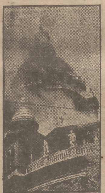
Los daños causados por el reciente incendio que se declaró en la cúpula de la Catedral de San Esteban, de Budapest, han sido valorados en 12.500 libras esterlinas. El accidente, como se dijo en su día, fué causado por un cortocircuito.