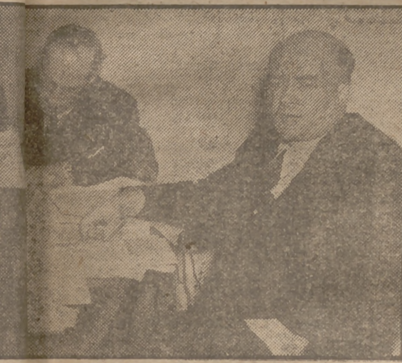
Polonia han celebrado las anunciadas elecciones y, según se ha llevado a cabo con la más estricta legalidad en todo el país. No opinan lo mismo de la "oposición", entre ellos Mikolajzky, que ha urdido el Tribunal Supremo polaco denunciando las elecciones irregulares por haber sido violado el secreto sufrido en la fotografía Stanislaw Mikolajzky, líder del partido polaco, en una conferencia de Prensa el día antes de las elecciones.