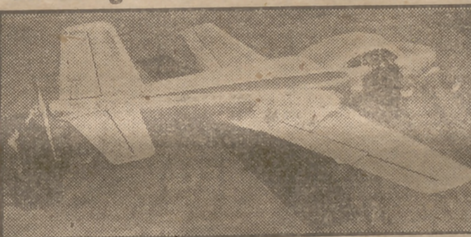
Un nuevo Douglas, cinco plazas, ha sido probado con gran resultado. La hélice va en la cola del aparato, eliminando así vibraciones y ruidos.