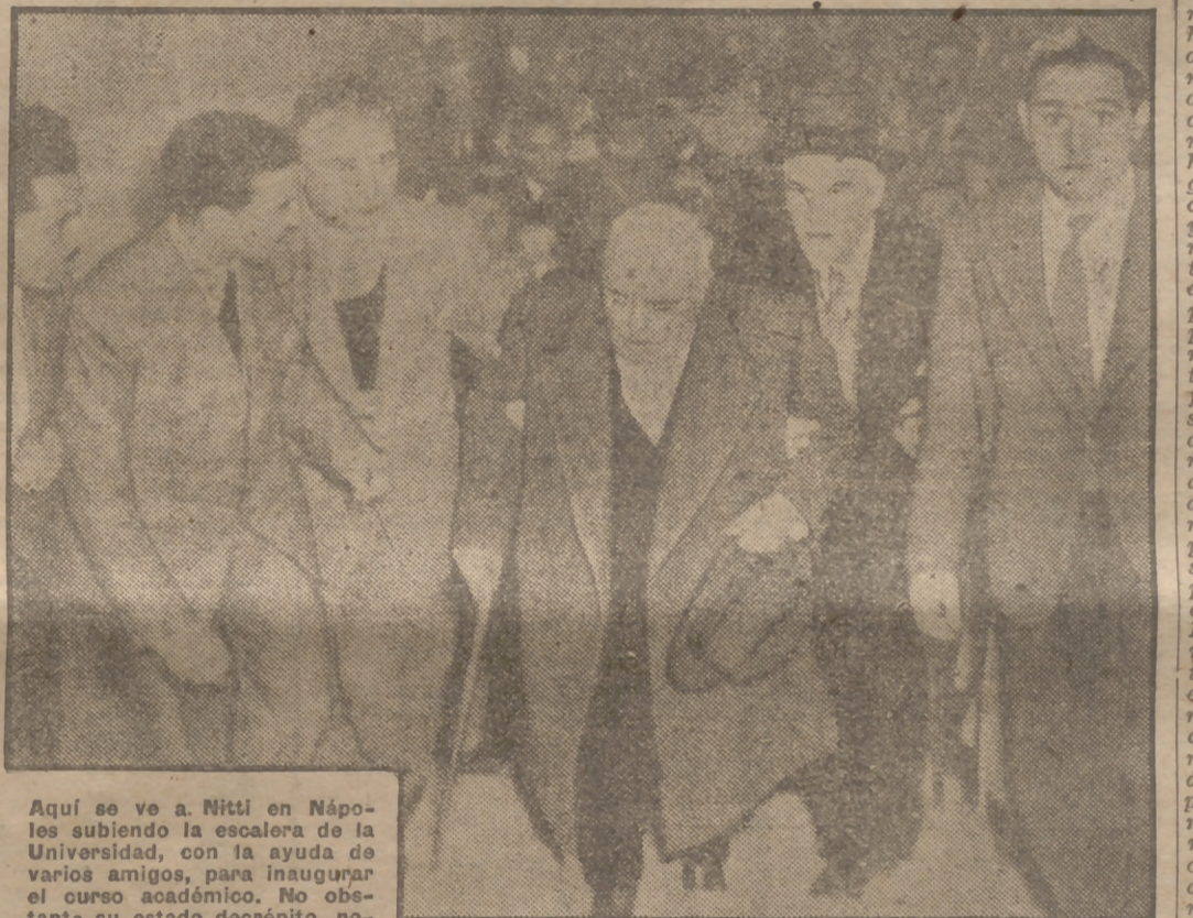
Aquí se ve a Nitti en Nápoles subiendo la escalera de la Universidad, con la ayuda de varios amigos, para inaugurar el curso académico. No obstante su estado decrepito, noticias de Italia señalan la posibilidad de que se confíe a Nitti la Jefatura del Gobierno ante las dificultades que De Gasperi encuentra para resolver la crisis italiana.