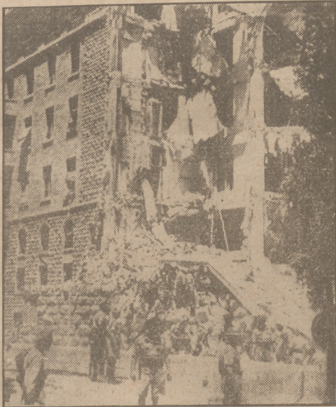
El día 22 de julio pasado, la terrible explosión de unas bombas colocadas en el sótano del edificio del hotel David, de Jerusalén, ocupado por el Alto Mando británico, determinó el hundimiento de una de las alas del mismo.

El nuevo éxodo de los judíos desde el este y el centro de todos los observadores, aun de los más remotos e indiferentes a los terribles avatares de esa raza. La U. N. R. R. A. trató de afrontar el problema, pero aparte de que esa entidad ha cumplido—en lo que pudo—en buena parte su cometido y se halla en período de desintegración, tampoco a ella han de achacarse responsabilidades ante un complejo de circunstancias en las que no intervienen únicamente factores económicos (únicos al limitado alcance de la U. N. R. R. A.), sino también políticos, históricos, sociales y raciales. Después de haber sido perseguidos con implacable saña en los años del nazismo, desaparecido éste tampoco se encuentran seguros los supervivientes judíos; de una parte porque en muchos países que circunstancialmente se titularon amigos suyos por necesidades estratégicas de la contienda universal, no se les ve con buenos ojos, y de la otra porque han refoñado contra ellos añejos agravios sobre el supuesto de una pretendida colaboración suya con los alemanes. Además, muchos de los que fueron dobles víctimas de la guerra y del sadismo gormánico se han encontrado sin hogar, sin familia, sin dinero y sin posibilidad de reconstruir su vida sobre tierras esquiladas y devastadas, donde todos son poco más o menos mendigos, salvo la breve minoría dirigente de funcionarios y políticos profesionales.