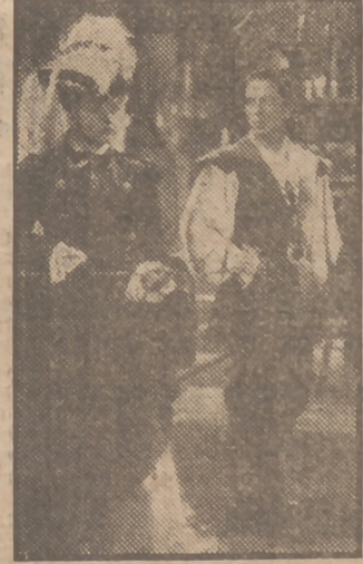
Ana Mariscal y Roberto Rey, pareja central de "La princesa de los Ursinos", obra maestra de nuestro cine, dirigida por Luis Lucia.