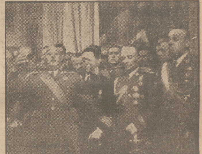
El Generalísimo dirige la palabra a los ministros de los Ejércitos de Tierra, Mar y Aire y otras altas representaciones militares en el acto celebrado hoy en el palacio del Pardo con motivo de la Pascua Militar.

Los ministros de los Ejércitos de Tierra, Mar y Aire cumplimentan al Generalísimo