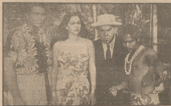
La bellísima María Montez, rodeada de John Hall y Sabú, en una escena de "La salvaje blanca", película que en breve será presentada por Distribuidora Chamartín.