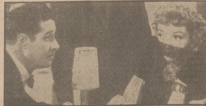
La bellísima Claudette Colbert y Don Ameche en una escena de "Lo que desea toda mujer", film presentado por Exclusivas Floralva en el cine Avenida y que con gran éxito de público ha entrado en su segunda semana de proyección.