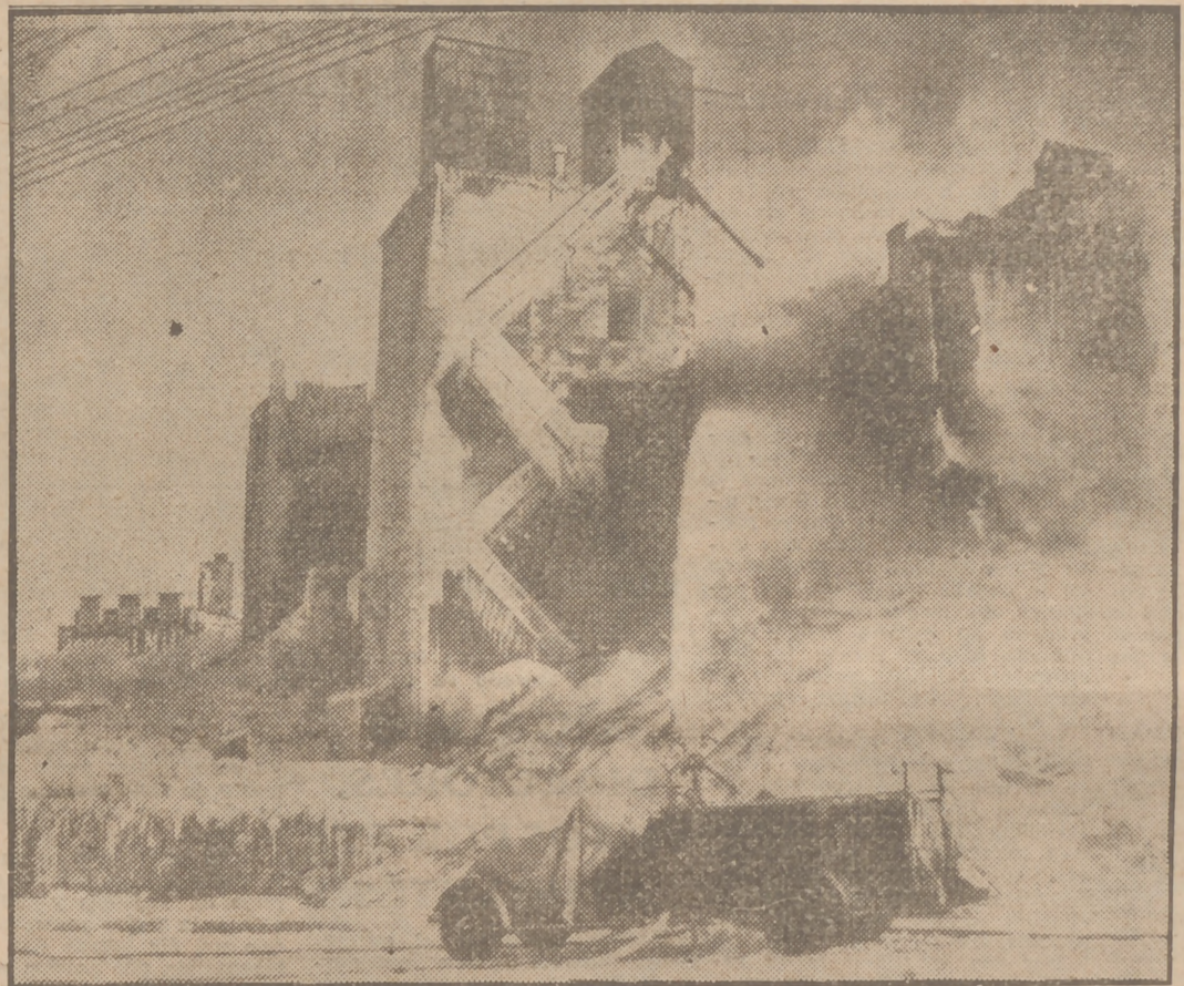
En Minneapolis, un gran incendio fué sofocado con el empleo de un lanzaespuma. Después del siniestro, uno de los edificios quedó como si hubiera caído sobre él una gran nevada.