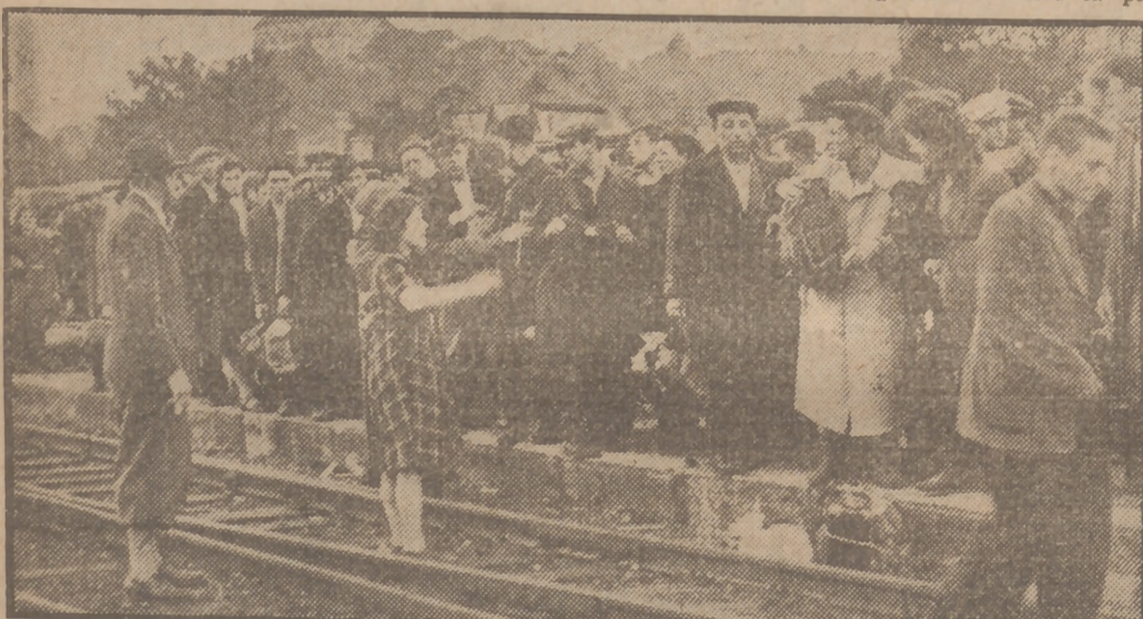
Un grupo de Judios polacos espera en la estación de Nachard (Checoslovaquia) el tren que los conduzca a Bratislava. Allí eran recogidos por elementos de la U. N. R. R. A.