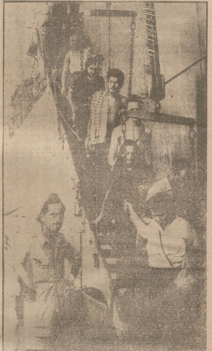
Los pasajeros de un barco que se proponía llegar clandestinamente a Palestina son obligados a desembarcar para internarlos en un campo de concentración.

Los refugiados judíos deben pasar desde Polonia hasta Italia a través de Checoslovaquia y Austria. No se sabe cómo desaparecen de los campos de concentración, rumbo a la relativa seguridad de la Alemania ocupada por los norteamericanos o de Austria. Bajo esa realidad hay una tremenda historia de miseria. Los técnicos, los vigilantes y el resto del personal de la U. N. R. R. A. encargados de los campos de refugiados en Austria y Alemania no aciertan a justificar las fugas. "Todo lo que yo sé—confiesa un oficial superior de la U. N. R. R. A. en el Austria septentrional—es que una mañana, al despertarme, me encontré con que habían desaparecido del campo de mil a dos mil judíos. Mi deber consiste en vigilar por la seguridad de esta gente mientras vive en el campo, ¡y, gracias a Dios, ya se han marchado!" En la zona norteamericana de Austria hay unos 60.000 refugiados, que esperan la primera oportunidad para huir. Hasta hace unos meses las facilidades eran mayores por el tráfico clandestino a bordo de buques rumbo a Palestina.