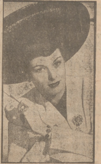
La bellísima y atractiva actriz Maureen O'Hara, a quien veremos como protagonista de "Conflicto sentimental", el más bello y humano de los argumentos cinematográficos, una gran superproducción de la 20th Century Fox, cuyo estreno tendrá efecto hoy, lunes, en el Palacio de la Música.

Hoy, lunes, reestrenará este film de gran éxito el Real Cinema.