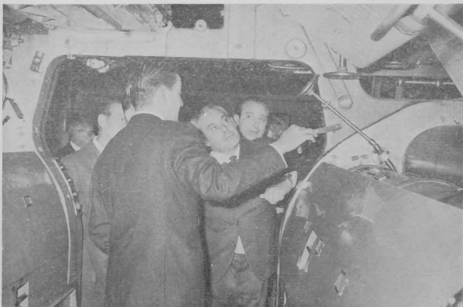
Un aspecto muy parcial e interior de la gran rotativa que marca una nueva etapa de «La Voz». Octubre de 1966.