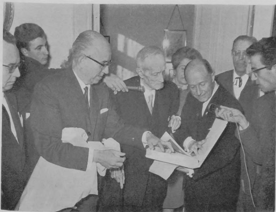
El entonces alcalde de la capital de España, conde de Mayalde, acudió en enero de 1965 al domicilio del señor Martínez Ruiz para hacerle entrega, en medio de la expectación radiofónica, del primer ejemplar del libro «Madrid», obra del inolvidable maestro de las letras españolas.

«Don Torcuato Luca de Tena aparece en la Redacción después de media noche y entra en la sala del trabajo comunal. No había existido director de periódico más obseso con su periódico. Don Torcuato Luca de Tena piensa en todo, lo prevé todo, lo perfecciona todo. No hay detalle en la casa, en el periódico, que escape a su mirada. Desde el tamaño de las letras, en las distintas secciones del periódico, hasta la organización del trabajo de los corresponsales, todo, todo está inspeccionado por el director. Junto a la mesa de trabajo, don Torcuato charla con los redactores. En el meñique de su mano izquierda lleva una gruesa sortija de hierro con fúlgido diamante: fortaleza y claridad. Y también don Torcuato Luca de Tena, en los momentos delicados, me convoca a su casa. Sentado don Torcuato en sillón fraileró,