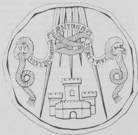
Escudo de la Escuela Oficial de Periodismo.

Uno de los proyectos estudiados a lo largo del pasado año ha sido el de reforma de los estudios de la Escuela Oficial de Periodismo. Asimismo se estudió el proyecto de dicha Escuela de organizar cursos intensivos de Información Técnica para sus alumnos. El correspondiente dictamen fue emitido a propuesta de la Dirección General de Prensa.