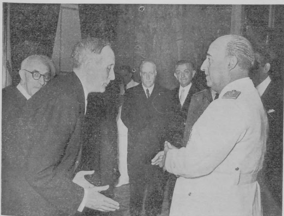
En junio de 1950 Su Excelencia el Jefe del Estado tuvo a bien recibir en audiencia especial a los miembros del Patronato de la Biblioteca Nacional. En la foto, el Caudillo de España conversa con don José Martínez Ruiz.