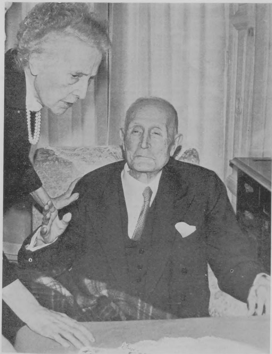
El eximio escritor, junto a su esposa, en sus últimos tiempos.