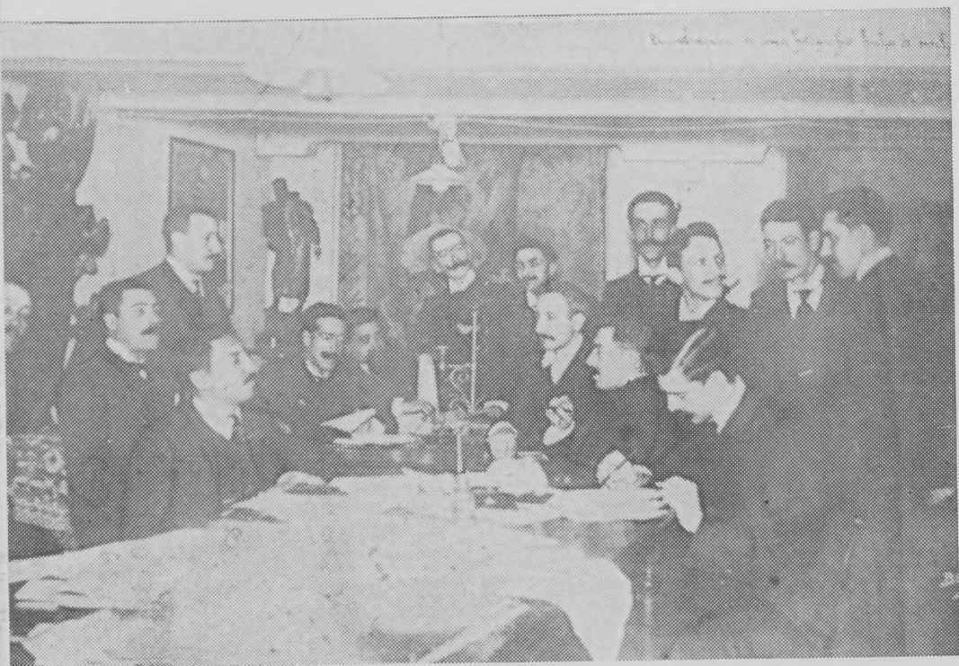
Redacción de «La Voz de Galicia» en 1904.