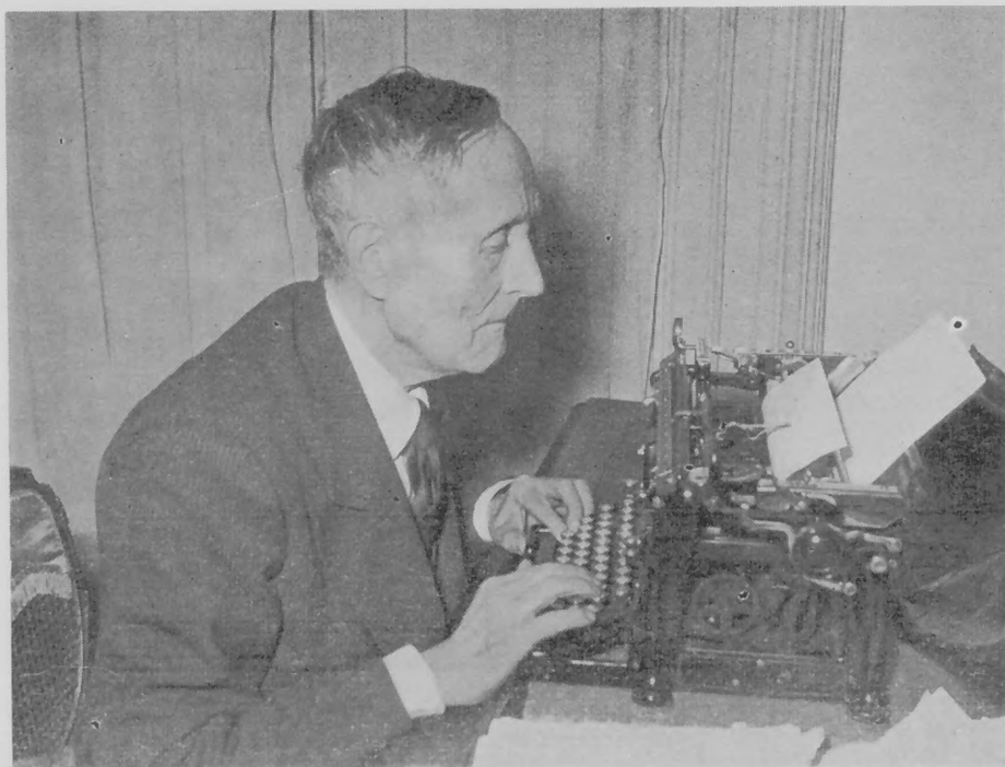
El ilustre escritor, el creador literario de la apretada y mínima caligrafía, a veces había preferido la fría escritura de los tipos mecanográficos.