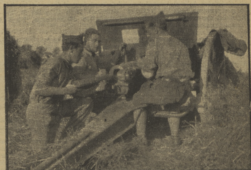
Una pieza de la batería «Germinal Vidal» disparando durante un combate habido en el sector de Almuédvar