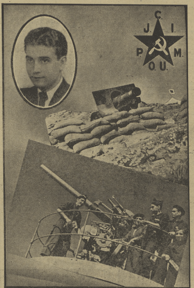
(Fotografías editadas por nuestro Partido.)

La característica del movimiento hasta el 19 de julio, era la hegemonía de los partidos pequeño-burgueses, y la sumisión de las masas obreras y campesinas a la política de aquellos partidos. El 19 de julio representa un cambio, un desplazamiento fundamental en el centro de gravedad de nuestra política desplazamiento que se inició en Asturias el octubre del año 1934. Este cambio de la hegemonía política en favor de los partidos y las concepciones obreras, es la llave de la situación actual, su causa. (Continúa en la página cuatro.)