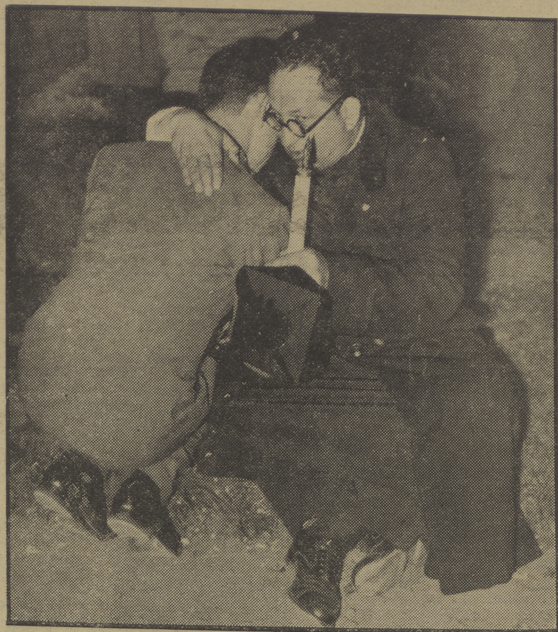
Mientras los obreros españoles se batían el 6 de octubre de 1934 en España, la Iglesia católica daba estos espectáculos edificantes...