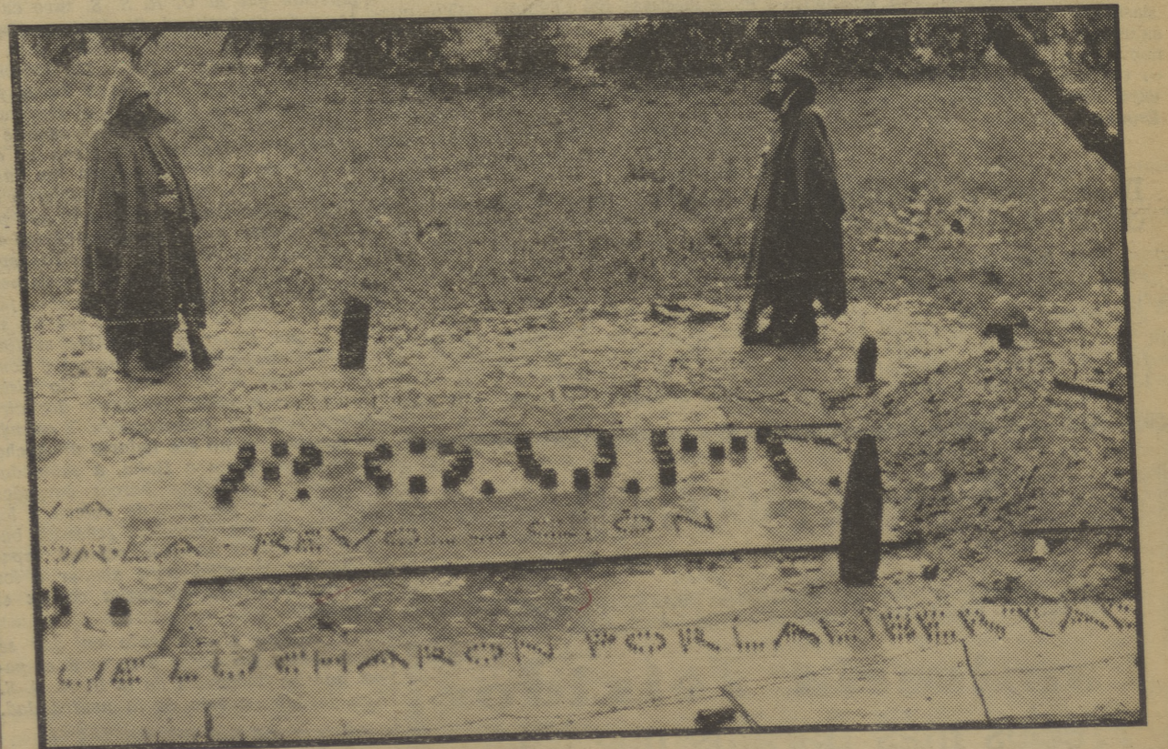
Los milicianos de la columna del P. O. U. M. en las avanzadas de Huesca, han construido un cementerio, donde reposan los cuerpos de los camaradas que han dado la vida por la Revolución y donde hay siempre montada una guardia de honor.

En la revista semanal del Partido Comunista de España, «La Correspondencia Internacional» se publica en primer lugar un artículo en ocasión del segundo aniversario de Octubre. Este artículo que se presenta textualmente como «Manifiesto del Comité Central del Partido Comunista de España» empieza con la sentencia formidable: «Hoy hace dos años que el pueblo español se levantó en armas en defensa de la República democrática contra el fascismo.» Sin duda pasará a todo lector de esta frase lo mismo que pasó a nosotros, que tenemos que releer estas palabras para poder creer que los stalinistas realmente han podido escribir una mentira tan palpable y tan escandalosa. No hace falta de leer lo demás. Es repugnante esta manera de desnaturalizar el hecho (Continúa en la pág. 6.)