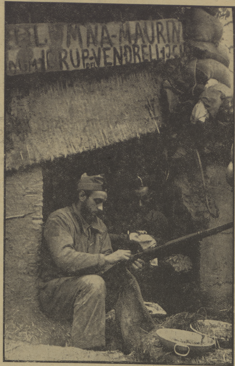
NUESTRAS AVANZADAS SOBRE HUESCA. — Ha comenzado el frío y las lluvias en el frente, y nuestros valerosos milicianos tienen que construirse refugios...

El Híroco con partidos religiosos crea una confusión que puede ser fatal, y es más peligroso aún, porque es reconocer calladamente el poder político usurpado por la efa de una manera desvergonzada. La verdadera revolución socialista debe evitar estos errores. No teme rechazar esta clase de aliados ya que, éstos son sus enemigos mortales. Conoce solo medio para satisfacer las necesidades eternas del hombre; enfocarle la luz de la ciencia libre, asegurarle la mayor felicidad, e interesarle tanto por la vida real que no debe preocuparse ya de las cuestiones sobre un emás allá más o menos misterioso. El hombre libre no tiene más que una creencia: el amor a la vida, y precisamente para hacer triunfar esta creencia hemos iniciado esta gran revolución.