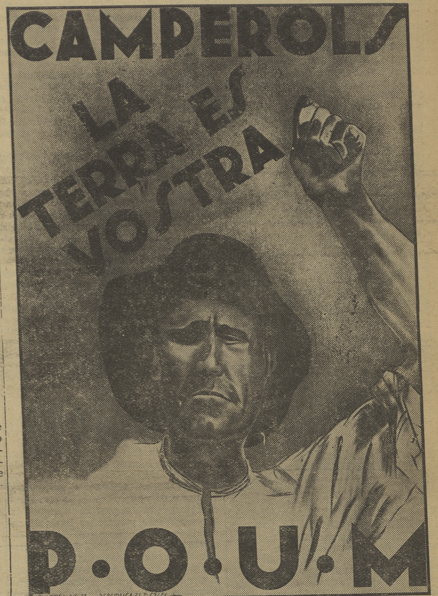
OTRO CARTEL DEL P. O. U. M. — Los carteles de propaganda de las consignas del P. O. U. M. van apareciendo uno tras otro, realizados por artistas revolucionarios que ponen su arte al servicio de la revolución. El fascismo que publicamos hoy, que viene a unirse a los publicados hasta ahora, es del cartel que recuerda a los campesinos que sólo la revolución socialista puede hacerles dueños del fruto de su trabajo. Como los otros, deben ser solicitados por las Secciones en el Secretariado de Propaganda del Partido. Ha sido editado también en catalán y castellano.