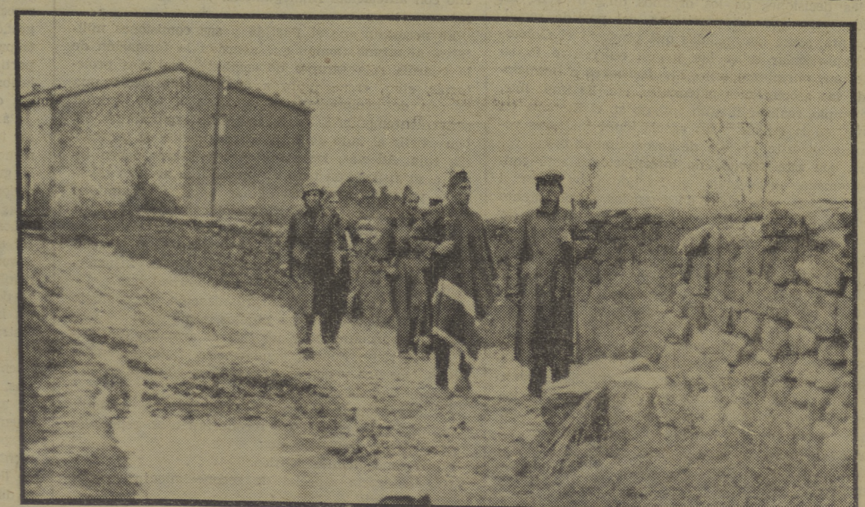
A causa de las fuertes lluvias, las calles y carreteras de los pueblos se encuentran completamente intransitables, como se ve en esta foto de una calle de Tierz. Es preciso ayudar a nuestros milicianos enviando prendas de abrigo al Socorro Rojo del P. O. U. M. (Pelayo, 62)