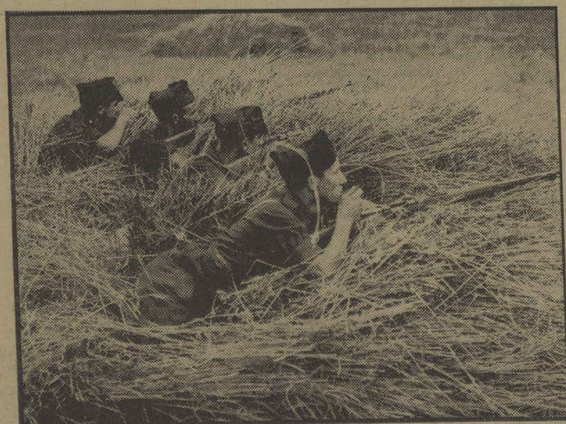
Los milicianos obreros del Norte tirotean intensamente a los rebeldes carlistas, escondiéndose entre el trigo, que los acoge y los protege

El P. O. U. M. de Tarrasa lleva a cabo una actividad extraordinaria en todos los terrenos: en el militar, en el sindical, en el de propaganda y organización, etc. Felicitemos fraternalmente a nuestros camaradas.