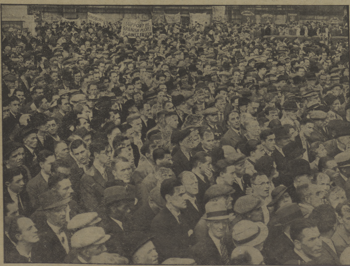
En Trafalgar Square (Londres), se ha celebrado una gran demostración antifascista, asistiendo 30.000 miembros de los Sindicatos obreros de Inglaterra. Varias banderas llevaban la inscripción «Ayudad al pueblo español contra el fascismo». La foto está tomada durante el discurso del miembro laborista del Parlamento, George Lansbury.