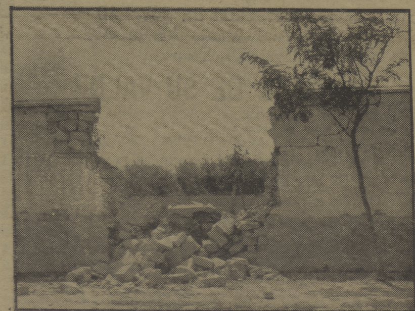
He aquí la pared de una casa de Tardienta, derribada por las bombas.

Publicamos el hecho por si no tuviera noticias de él quien debe tenerlas y advertimos a ese cónsul que no está lejana la hora en que los obreros tengamos que autorizarle a él un pasaporte, pero para un viaje al Limbo, que es a donde, según los suyos, van los imbéciles.