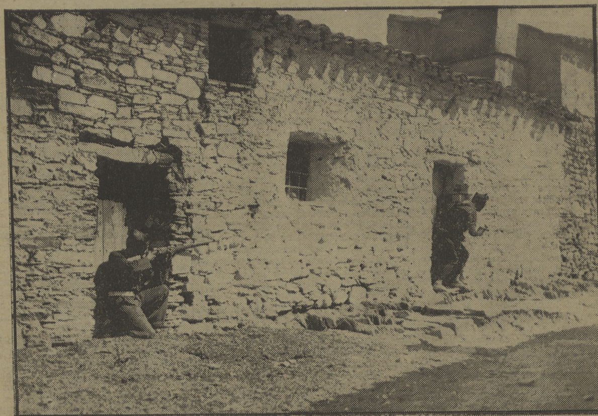
Los primeros milicianos de la columna «Fantasma» que entraron en Valdeacasa, trotearon a los pocos fascistas que se hicieron fuertes