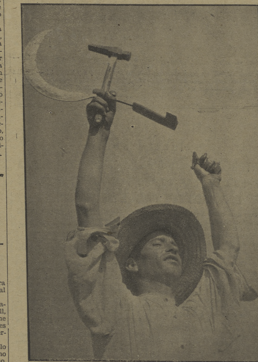
El campesino extremeño, libre hoy de la reacción cavernaria, expresa su adhesión a la Revolución proletaria en marcha. Obreros y campesinos juntos la llevarán a la victoria