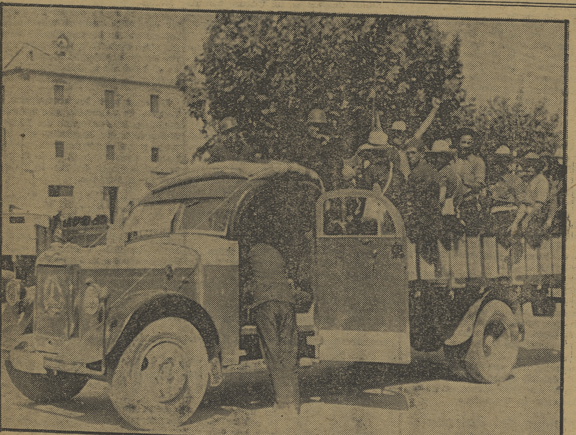
De Sarrión salen refuerzos hacia Grañén, más cercano a Huesca, que pronto caerá ante el empuje de los obreros.

Los ferroviarios ven pasar las ambulancias en silencio. El comandante dice: «¡Viva la República!» a la puerta del puesto sanitario. Los trotskystas cantan «La Internacional» y quieren irse a Atienza. Me gusta que, mezclado entre estos hombres, los ferroviarios me miren con admiración.