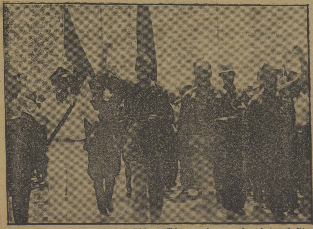
El capitán Urribarri acompañado de otros oficiales y milicianos, que han cooperado en la toma de Ibiza, saliendo a su llegada al puerto de Valencia.

El Cabo, 14.—Están interrumpidas todas las comunicaciones con las Islas Canarias. El telégrafo está intacto, pero no responden desde Canarias a las llamadas que se les hacen. Corre el rumor de que la población obrera se ha levantado contra los insurrectos. Se habla de que se ha declarado la huelga general.