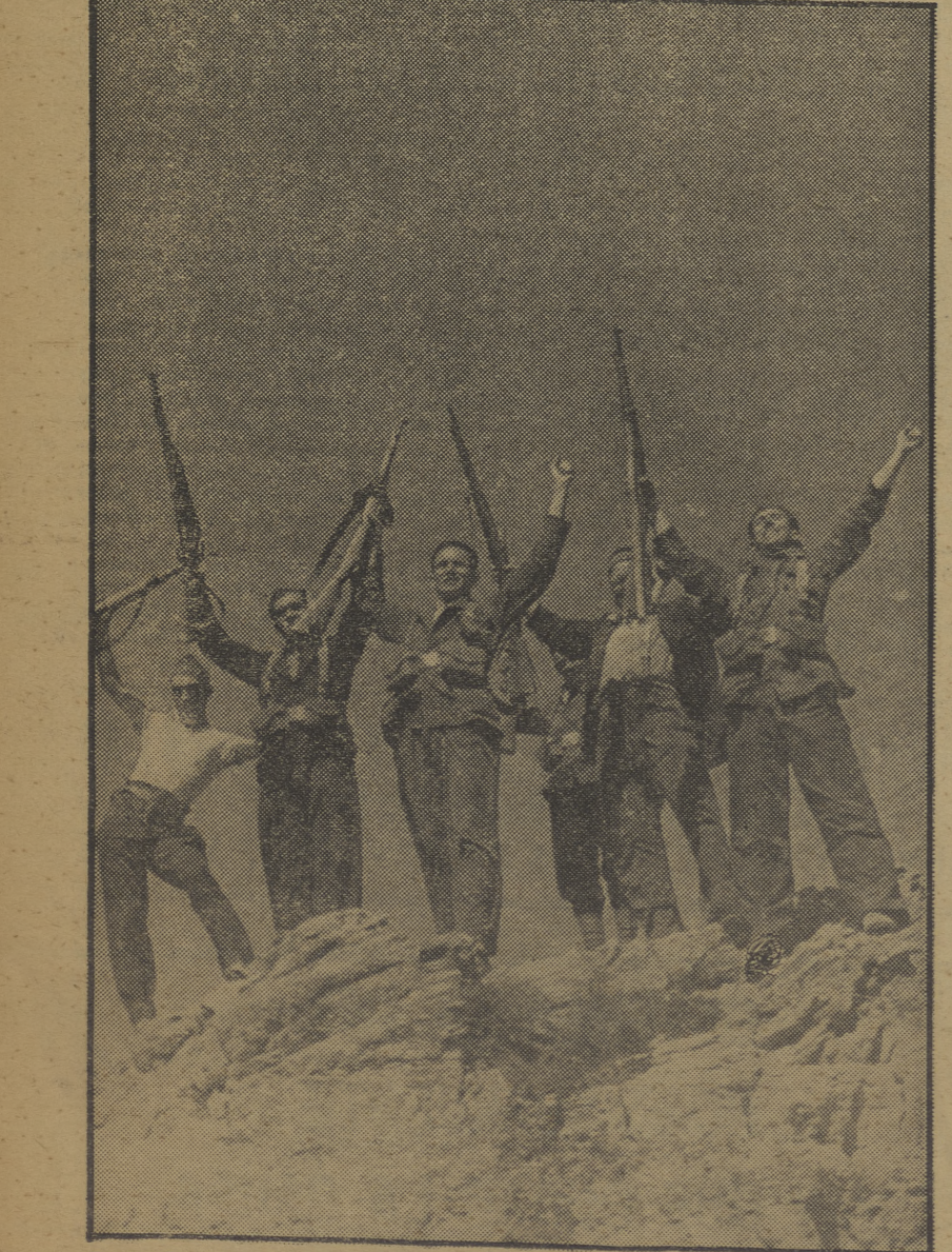
La columna de milicianos inflige una tremenda derrota en Sigüenza a los facciosos, dejando éstos abandonados en su huida 49 muertos, gran cantidad de municiones, ametralladoras, morteros y cañones. Ved aquí un grupo de obreros subidos en las rocas de los alrededores del pueblo, con el gesto fogoso del triunfo obtenido.

Llegamos al adar de Benarda, último de la zona española, y allí nos sentamos para descansar al abrigo de un almízar de paja. Bebemos agua y el morito que nos acompañaba buscó dos mulas de carga de las que estaban en el campo y continuamos el camino montados en ellas, yo con una de las moritas tras de mí y el morito con otra, las demás volvieron a Alcazar. Nos acompañaba (Sigue en la pág. 7)