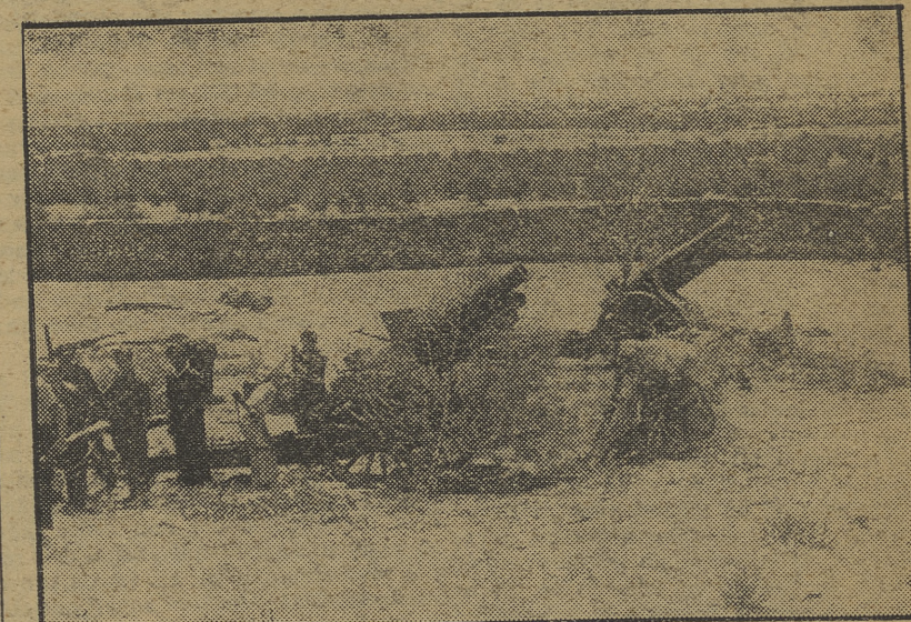
Baterías del 15 1/2, emplazadas y camufladas en Guedarrama, que cada día castigan seriamente a las tropas fascistas.

Ocupada Leciñena a las diez y media de la mañana, las fuerzas de retaguardia, que habían quedado con Piquer en la caseta, avanzaron con varias ametralladoras tomando el Santuario de Ma-