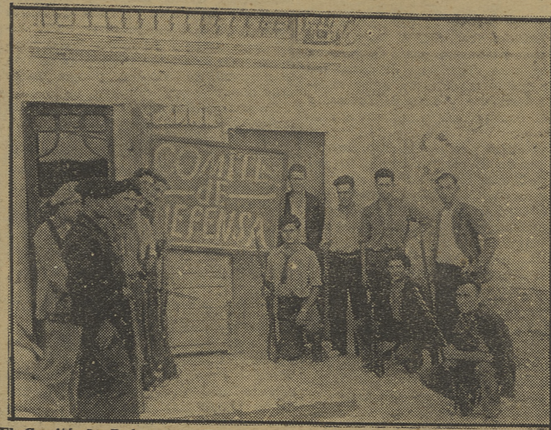
El Comité de Defensa en Fraga, que dirige toda la vida de la ciudad aragonesa.

El mismo día que los soldados regresaron, a las pocas horas de llegar se sublevaron.