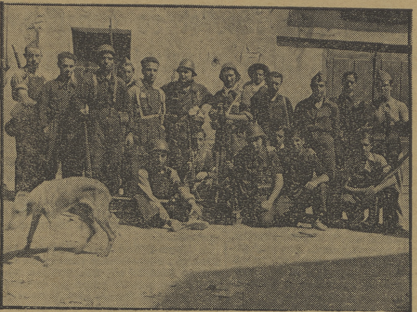
Una guardia avanzada de la columna del P. O. U. M. en el pueblo de Alcubeire, que abre el avance de los obreros catalanes, sobre Huesca y Zaragoza.