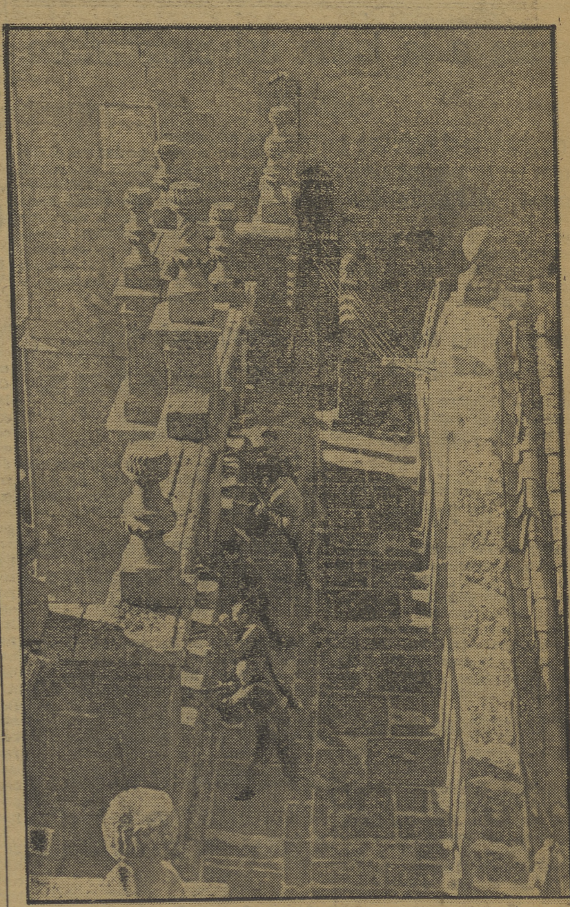
Estos milicianos, apostados en las torres de la Catedral, haciendo fuego sobre los rebeldes que se hallan en las lomas.

Buques rebeldes echados a pique Orán, 14.—La lancha española «Pilar Salas» desembarcó en Orán las tripulaciones de dos lanchas españolas que zozobraron a lo largo de Melilla el lunes pasado y fueron luego echadas a pique por un submarino gubernamental, con lo cual impidiéndose el abastecimiento de Melilla.