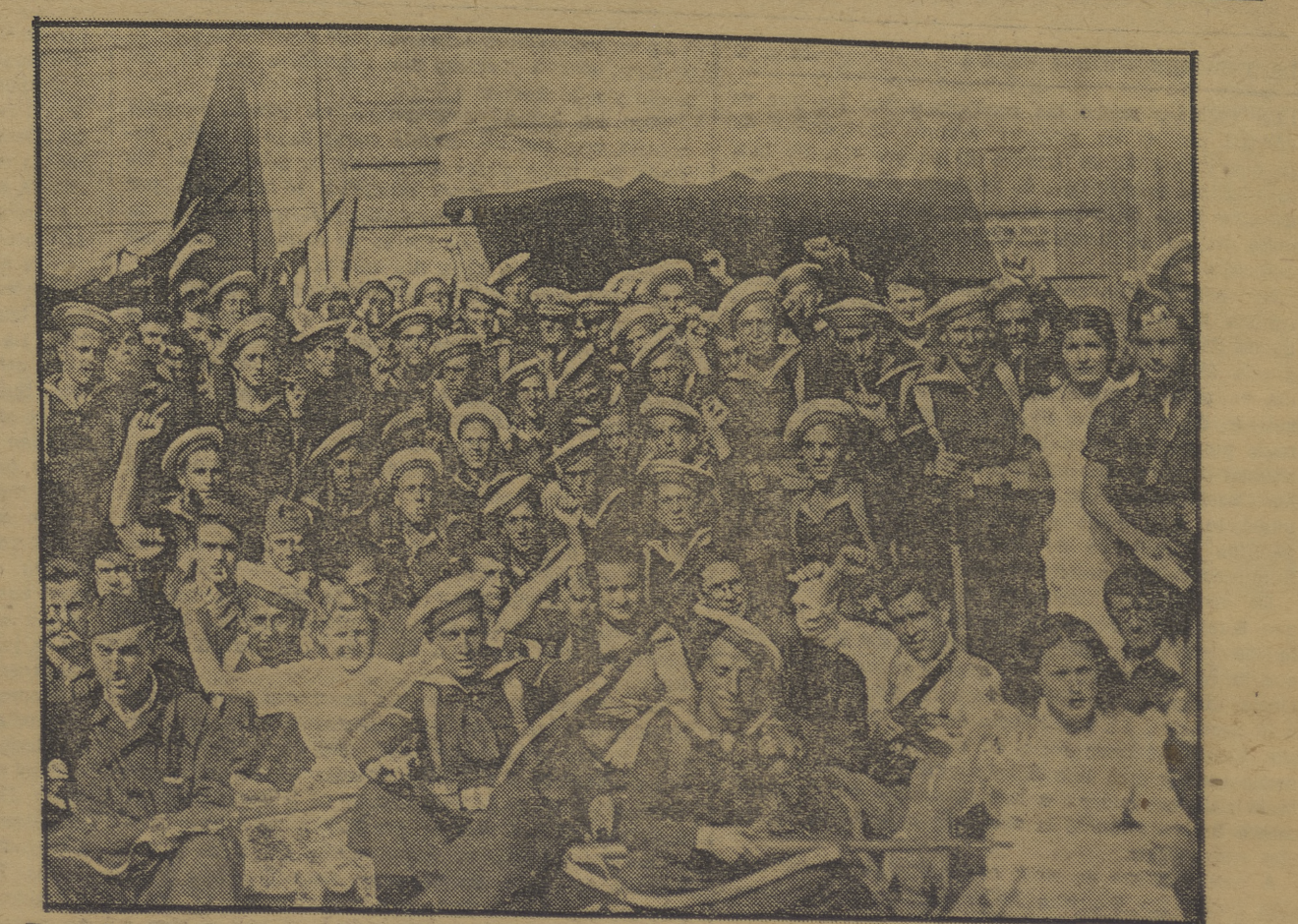
He aquí un grupo de marineros del «Almirante Miranda» junto con diversos miembros del Comité Ejecutivo del P. O. U. M., después de hacerles éstos entrega a los primeros de una bandera roja, para clavarla en lo más alto de Palma de Mallorca.

Mañana publicaremos un extenso y detallado reportaje sobre la organización de los Comités de marinos y sobre su actuación.