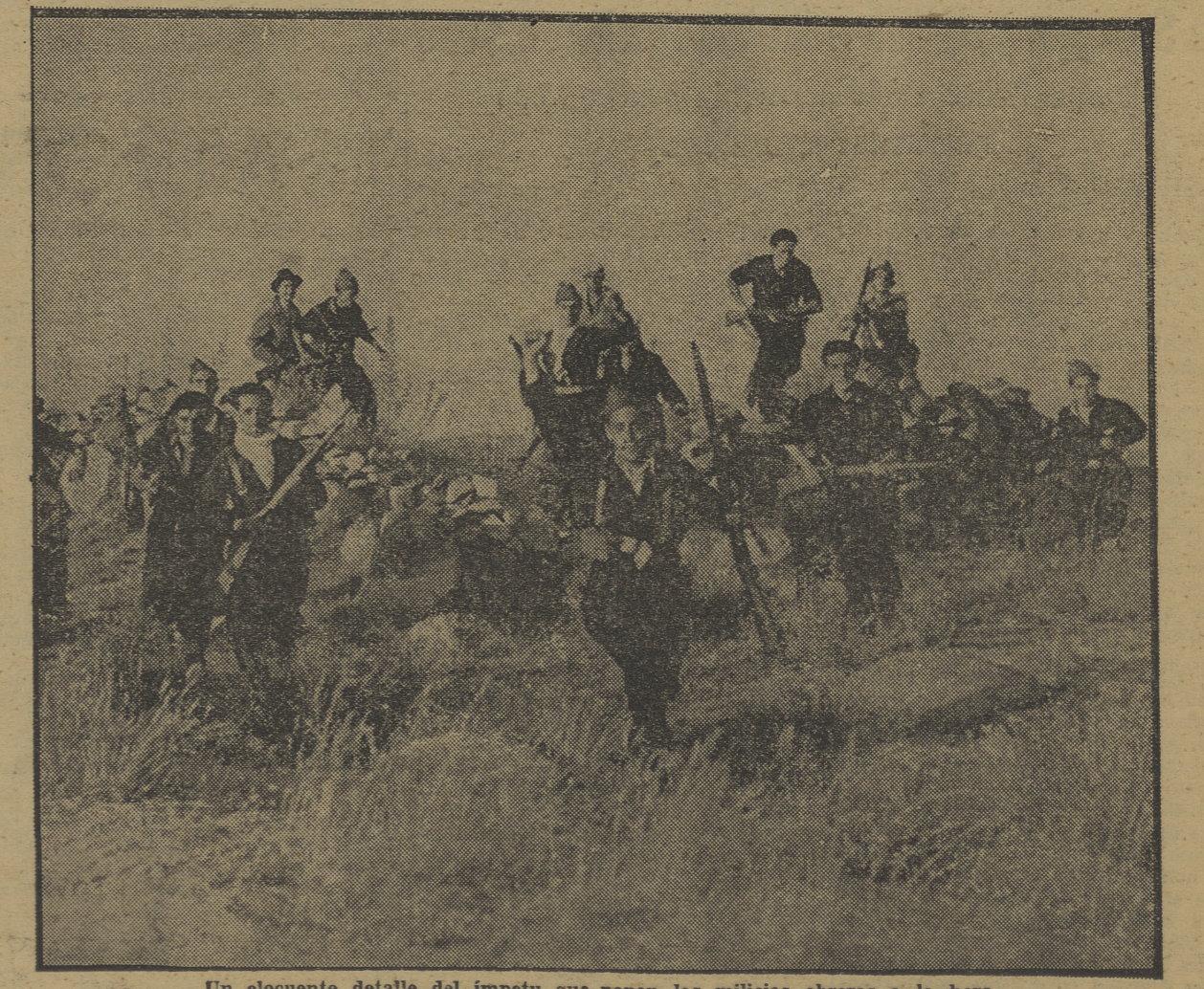
Un elocuente detalle del ímpetu que ponen las milicias obreras a la hora del ataque, en las avanzadillas.

Qué largo se me hizo el vado. No podía andar, los calcetines mojados, las buchas que me hacían un daño horrible