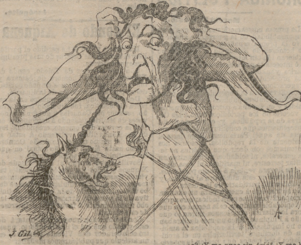
ALBIÓN, LA DESINTERESADA.—¿Y han firmado la paz? ¿Y me queo sin tajá? ¿Y me han tomado el pelo? ¡Mardita sea mi suerte!

das las obras que se refieren a la historia de esta ciudad, viene figurando con igual dictado.