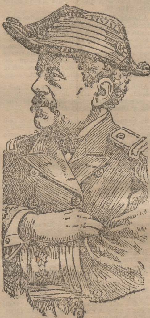
Don Fernando Villaamil

Jefe de la primera escuadrilla de torpederos que en breve ha de zarpar de Cadiz con rumbo a la isla de Cuba.