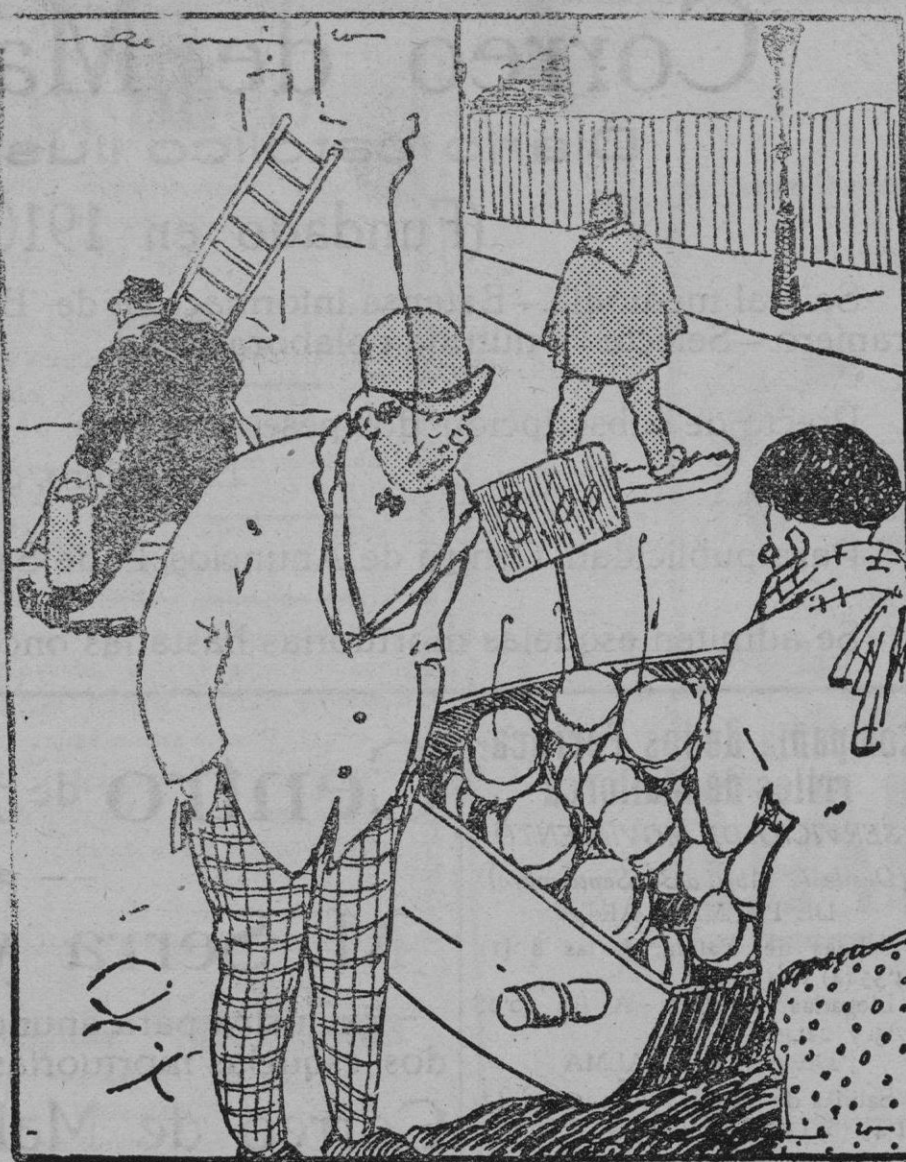
La vida cara