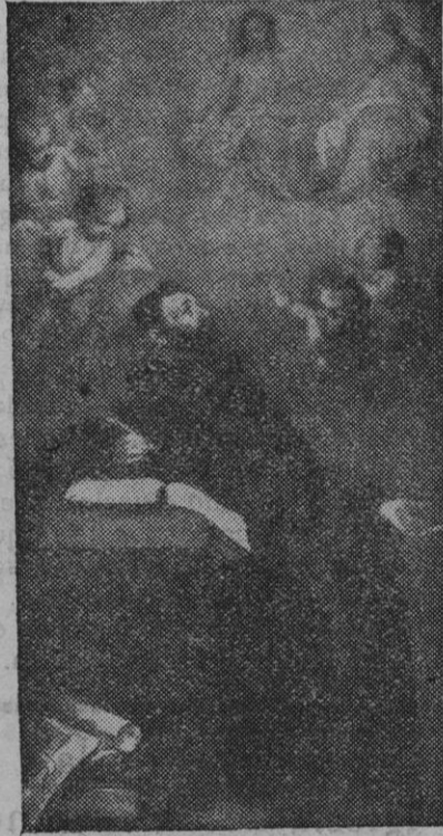
San Agustín y la Santísima Trinidad, cuadro de Murillo (Museo de pinturas de Sevilla).

Tal es el dulce Patriarca que tuvo por madre a la más dichosa de todas las madres, Santa Mónica, de la que dice Bougaud que su historia es un poema.