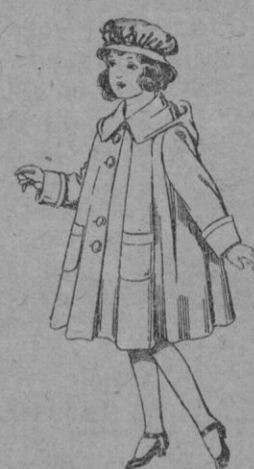
N.º 102.—Abrigos de gacardina impermeabilizada, para niñas de 4 a 12 años. De pts. 40 a 70