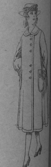
N.º 98.—Abrigos de lana para jovencitas de 10 a 15 años. De pts. 35 a 40