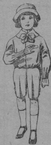
Traje de patén para niños de 4 a 9 años. De pts. 9 a 14