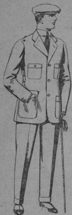
N.º 2.—Trajes de cheviot, corte elegante para sportman. De pts. 45 a 55