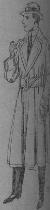
N.º 16.—Gabanes mejorados, con cinturón de color beige. De pts. 65 a 115