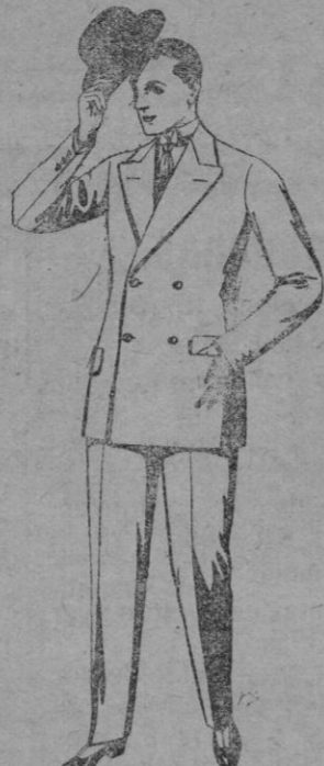
N.º 3.—Trajes de cheviot, patén, etc. De pts. 27 a 80. Trajes de vicuña o jerga. De pts. 30 a 85. Los mismos, a medida. De pts. 65 a 135