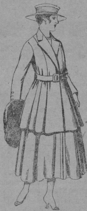
N.º 44.—Traje de lana, para señora, en color negro y azul. De pts. 85 a 100