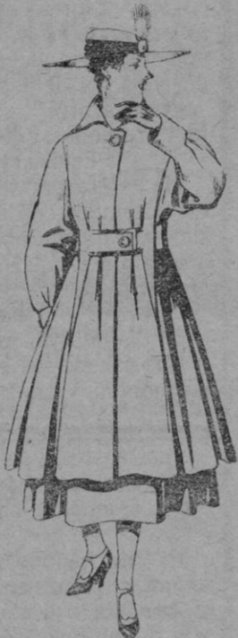
N.º 53.—Abrigo de patén, en color para señora. De pts. 65 a 75