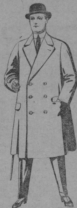
N.º 5.—Gabanes de patén o cheviot, con cinturón. De pts. 50 a 110. Los mismos a medida. De pts. 65 a 145