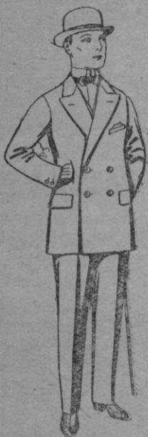
N.º 24.—Trajes de patén, vicuña, etc., para niños de 10 a 12 años. De pts. 23 a 45. Los mismos, para jóvenes de 13 a 16 años. De pts. 25 a 48