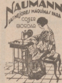
Máquinas coser NAUMANN. Bobina central. Precios más barato que nadie.