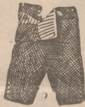
Pantalones niño, de 8 a 10 años. Pantalón drill y lana.

Primera casa en confecciones para caballero, señora, jóvenes y niños Tejidos, Pañería y Sastrería