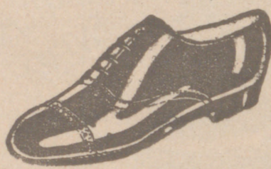
Zapatos los mejores, 18 ptas.

FABRICA DE LIBROS RAYADOS, DIARIOS, MAYORES, COPIADORES, ACTAS, ENCUADERNACIONES, ETC.