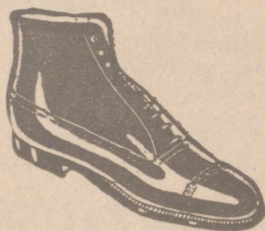
Botas las mejores, 19'80 ptas. Para Guardia Civil y de Asalto, 19'50

Sección calzados «Segarra» Venta directa del fabricante al consumidor