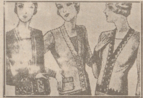
Blusas chaquetitas de 7, 8, 10, 12 y 15 ptas.