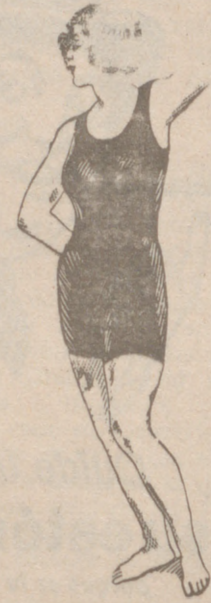
Trejes de baño en el godón o lana de 5,50, 4, 5, 6, 10, 12 y 15 ptas.