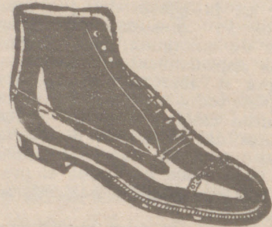
Botas las mejores, 19'80 ptas. Para Guardia Civil y de Asalto, 19'50

Sección calzados «Segarra» Venta directa del fabricante al consumidor