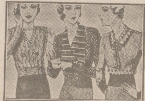
Blusas punto novedad a 5, 6, 8, 10 y 12 ptas.