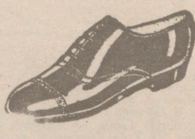
Zapatos los mejores, 18 ptas.