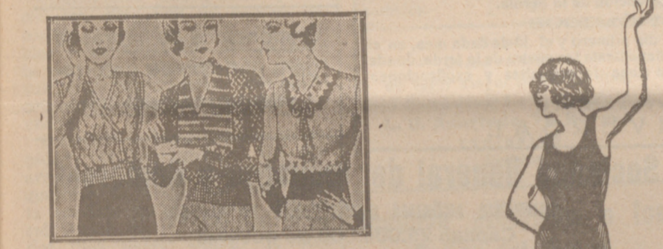
Blusas punto novedad a 5, 6, 8, 10 y 12 ptas.