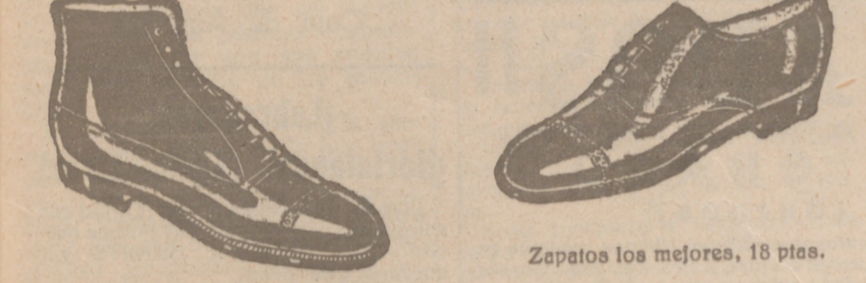
Botas las mejores, 19'80 ptas. Para Guardia Civil y de Asalto, 19'50 ptas.

Sección calzados «Segarra» Venta directa del fabricante al consumidor