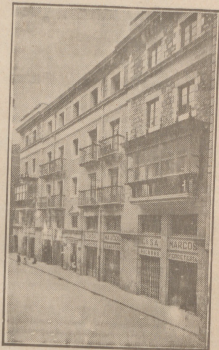
Fachada, por la calle de la Moneda, números 15 y 17, de la CASA SOCIAL propiedad de la Federación Burgalesa de Sindicatos Agrícolas Católicos.

Se hallan establecidas en su planta baja las Oficinas y talleres de máquinas de «El Castellano» y «El Defensor de los Labradores»