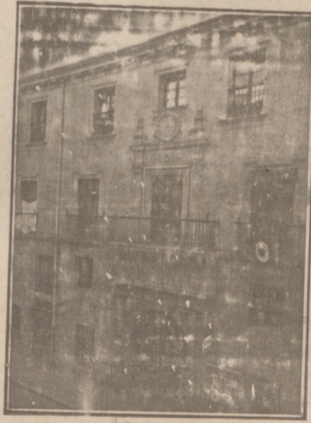
Entrada a las Oficinas de la Federación y MUTUALIDAD AGRÍCOLA BURGALESA. Calle de Santander, números 10, 12 y 14. Burgos.