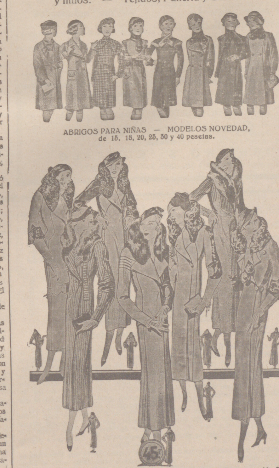
60 Modelos distintos en Abrigos Gamuzas NOVEDAD.—Modelos, creación Parísien a 25, 30, 40, 50, 60, 70, 80 y 100 pesetas

Casa Munguía Plaza Mayor 42 y Lata Calvo 9 Sucursales: Plaza Mayor, 5 BURGOS Primera casa en confecciones para caballero, señora, jóvenes y niños. — Tejidos, Pañería y Sastrería.