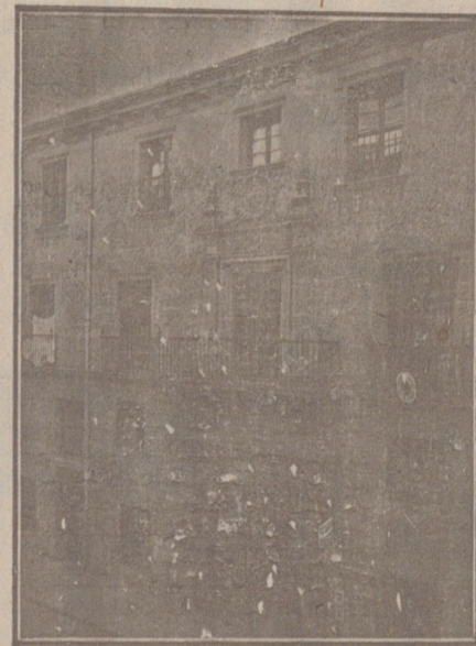
Entrada a las Oficinas de la Federación y MUTUALIDAD AGRÍCOLA BURGALESA. Calle de Santander, números 10, 12 y 14, Burgos.