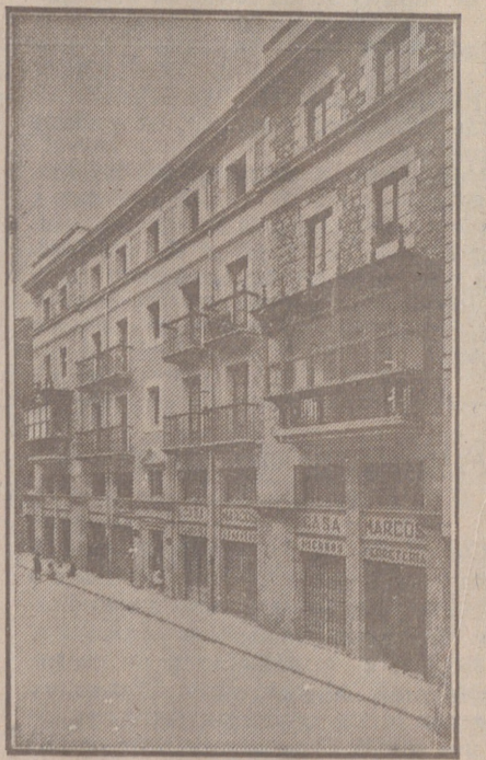
Fachada, por la calle de la Moneda, números 15 y 17, de la CASA SOCIAL propiedad de la Federación Burgalesa de Sindicatos Agrícolas Católicos.

Se hallan establecidas en su planta baja las Oficinas y talleres de máquinas de «El Castellano» y «El Defensor de los Labradores»