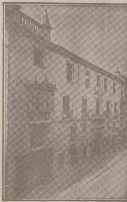
Fachada, por la calle de Santander, 10, 12 y 14, de la CASA SOCIAL propiedad de la Federación Burgalesa de Sindicatos Agrícolas Católicos.

Oficinas: (Casa de la Federación): Calle de Santander, 10 y 12 Burgos