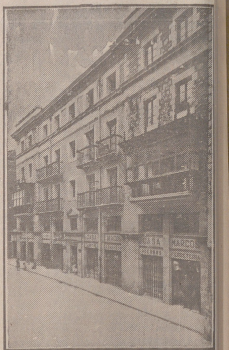
Fachada, por la calle de la Moneda, números 15 y 17, de la CASA SOCIAL propiedad de la Federación Burgalesa de Sindicatos Agrícolas Católicos.

Se hallan establecidas en su planta las Oficinas y talleres de máquinas de «El Castellano» y «El Defensor de los Labradores»