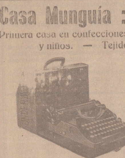
Máquina UNDERWOOD portátil último modelo, a 875 pesetas.

Primera casa en confecciones para caballero, señora, jóvenes y niños. Tejidos, Pañería y Sastrería.