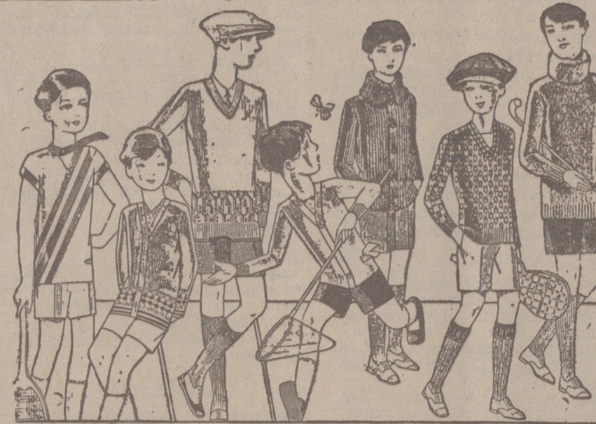
Jerseys para niños, dibujos novedad, desde 4, 4,50 5, 6, 7, 8, 10 y 12 ptas. Siempre gran surtido para elegir