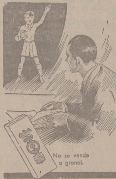
No se vende a granel.