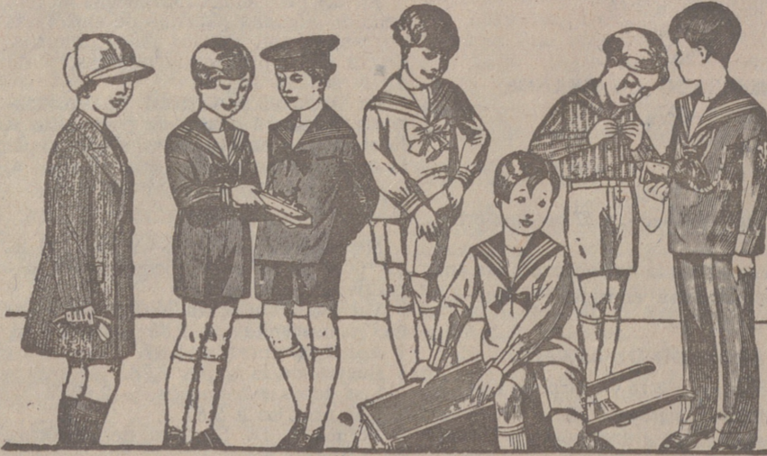
50 modelos distintos en trajes para niños en dril, en pana, en paño y en jergas azules, de 10 a 40 pesetas.

Plaza Mayor 42 y Lain Calvo 9 Sucursal: Plaza Mayor, 5 BURGOS Primera casa en confecciones para caballero, señora, jóvenes y niños. — Tejidos, Pañería y Sastrefía.