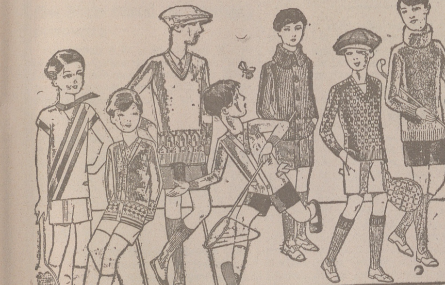
Jerseys para niños, dibujos novedad, desde 4, 4,50 5, 6, 7, 8, 10 y 12, ptas. Siempre gran surtido para elegir

IGNACIO PALACIOS ha recibido las primeras remesas de SIDRA ASTURIANA SUPERIOR A PRECIO REDUCIDO Descuento especial por consumo, al final de temporada BURGOS (Central) GIJÓN (Sucursal)