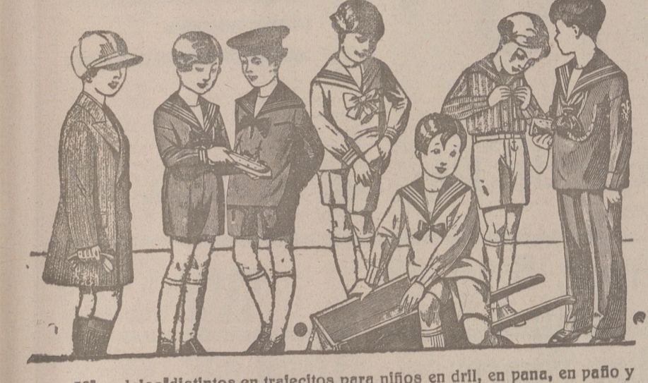
50 modelos distintos en trajectos para niños en dril, en pana, en paño y en jergas azules, del 10 a 40 pesetas.

Plaza Mayor 42 y Lain Calvo 9 Sucursal: Plaza Mayor, 5 BURGOS Primera casa en confecciones para caballero, señora, jóvenes y niños. — Tejidos, Pañería y Sastrefía.