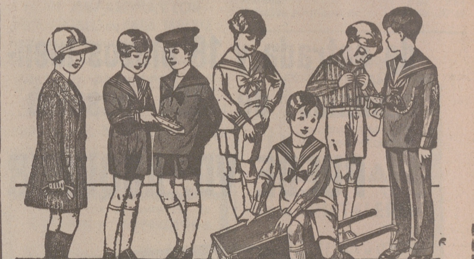
50 modelos distintos en trajectos para niños en drill, en pana, en paño y en jergas azules, de 10 a 40 pesetas.

Sección especial de efectos de oficina y máquinas de escribir UNDERWOOD. Habiendo concertado con una casa de Nueva York la venta directa de máquinas de escribir UNDERWOOD, recomiendo que antes de efectuar sus compras vea PRECIOS y calidades de estas máquinas.