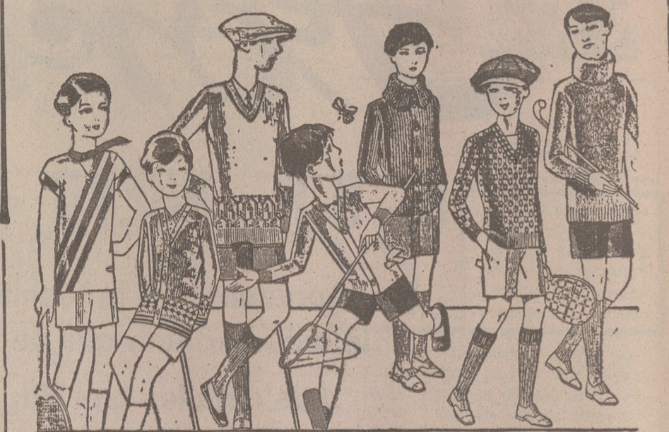
Jerseys para niños, dibujos novedad, desde 4, 4,50 5, 6, 7, 8, 10 y 12, ptas. Siempre gran surtido para elegir