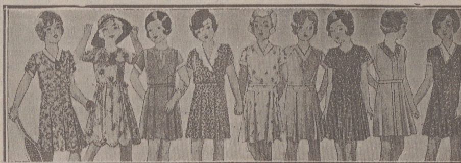
Vestiditos niñas edad de 5 a 10 años, en lana, crespón o punto a 10, 12, 15, 16, 18 y 20 pesetas.