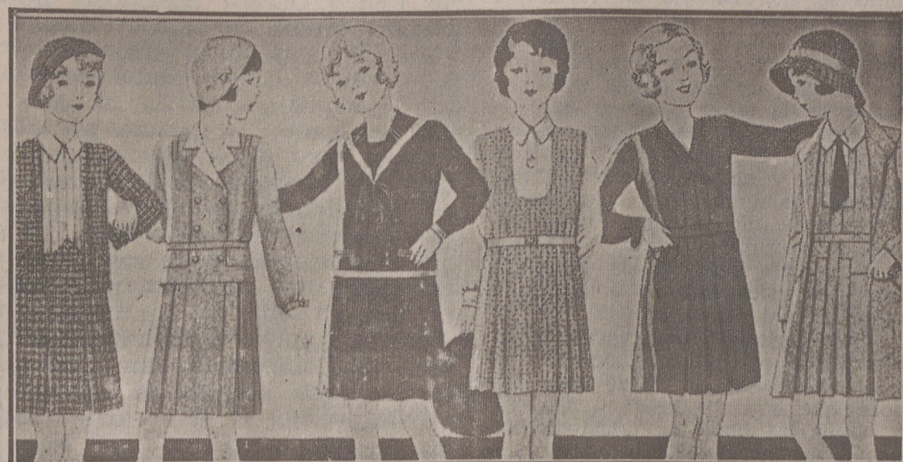
Vestiditos de lana, crespón seda y punto lana, edad de 8 a 14 años, a 14, 16, 18, 20 y 25 pesetas.

Primera casa en confecciones para caballero, señora, jóvenes y niños. — Tejidos, Pañería y Sastrería.