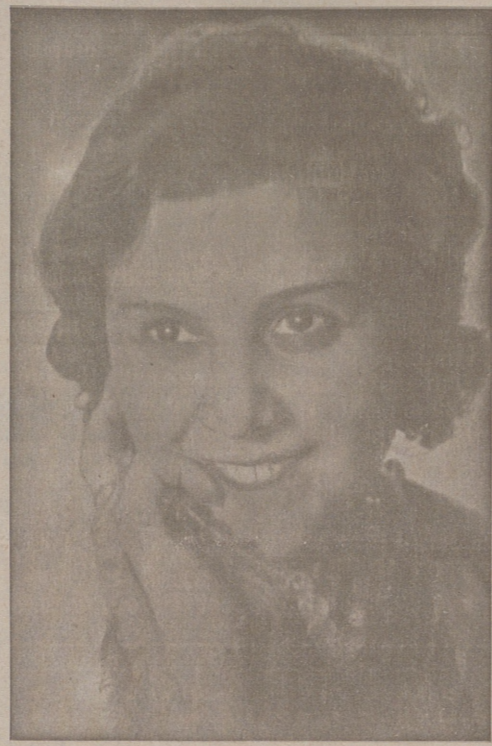
Raissa Borissova, soprano de la Compañía rusa de Opera de Cámara