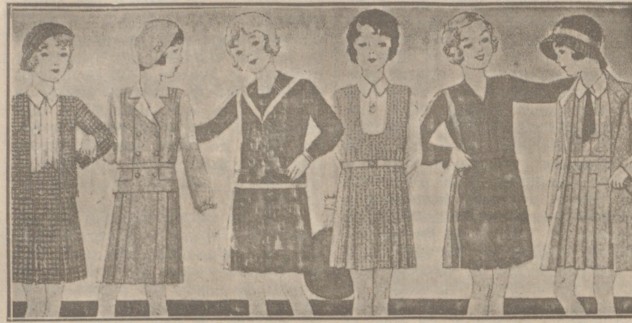
Vestiditos de lana, crespón seda y punto lana, edad de 8 a 14 años, a 14, 16, 18, 20 y 25 pesetas.

Casa Munguía Plaza Mayor, 42 y Lain Calvo, 9 Sucursal: Plaza Mayor, 5 BURGOS Primera casa en confecciones para caballero, señora, jóvenes y niños. — Tejidos, Pañería y Sastrefía.