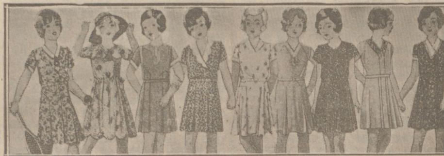
Vestiditos niñas edad de 5 a 10 años, en lana, crespón o punto a 10, 12, 15, 16, 18 y 20 pesetas.

Fabrica de libros de Comercio DIARIOS, MAYORES, COPIADORES REGISTROS Y RAYADOS DE TODAS CLASES Gran fábrica de cajas de cartón para todas las industrias Encuadernaciones PRECIOS MUY ECONÓMICOS ENRIQUE MARTINEZ Lain-Calvo, 12.—BURGOS