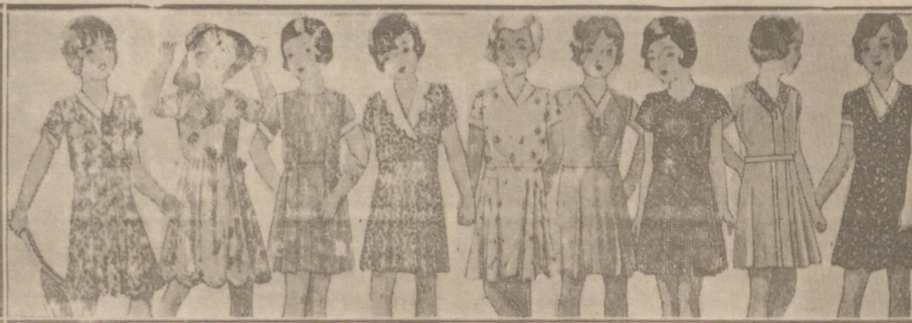
Vestidos niñas edad de 5 a 10 años, en lana, crespón o punto a 10, 12, 15, 16, 18 y 20 pesetas.