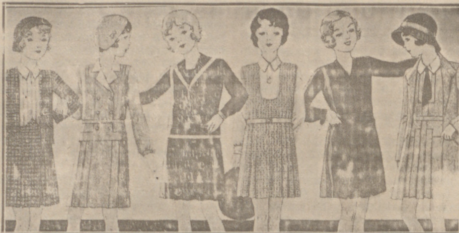
Vestidos de lana, crespón seda y punto lana, edad de 8 a 14 años, a 14, 16, 18, 20 y 25 pesetas.

Primera casa en confecciones para caballero, señora, jóvenes y niños. — Tejidos, Pañería y Sastrería.