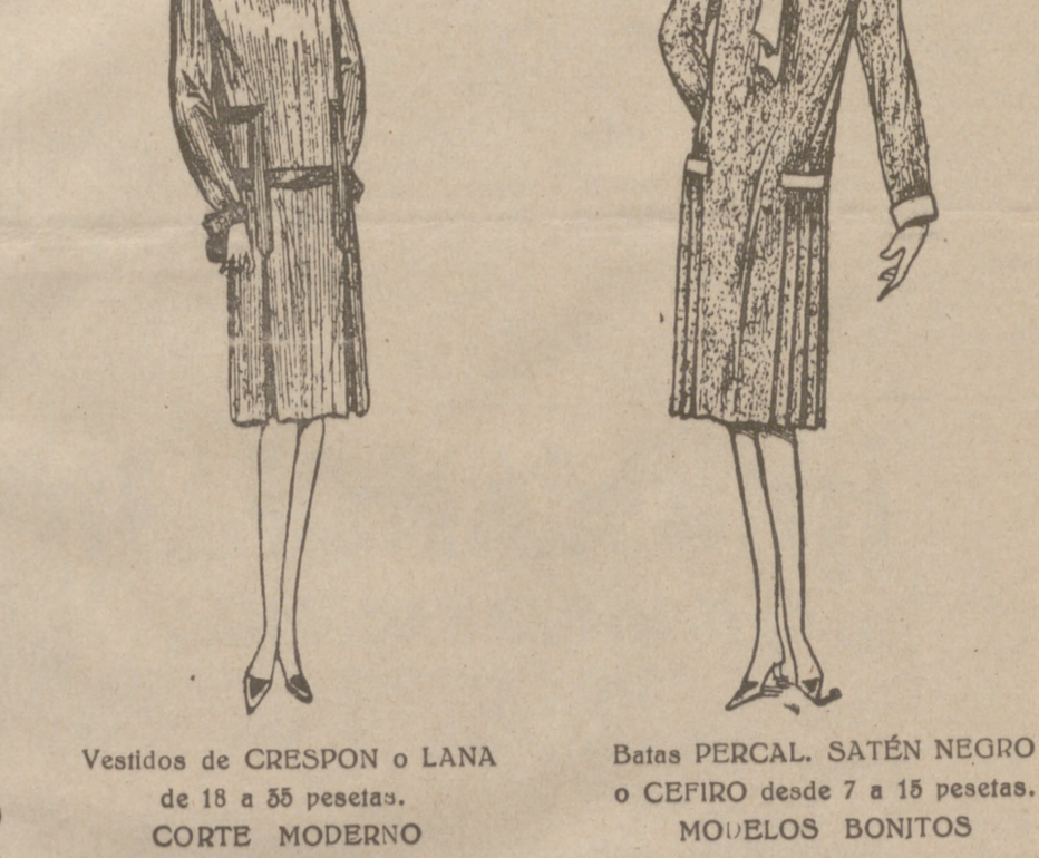
Vestidos de CRESPON o LANA de 18 a 55 pesetas. CORTE MODERNO Batas PERCAL. SATÉN NEGRO o CEFIRO desde 7 a 15 pesetas. MODELOS BONITOS

Plaza Mayor, 42 Lain-Calvo, 9 y 11 BURGOS Teléfono 603-R Primera casa en confecciones para caballero, señora y niños.