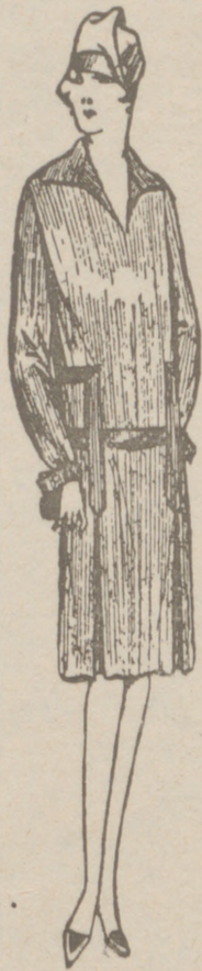
Vestidos de CRESPON o LANA de 18 a 55 pesetas. CORTE MODERNO