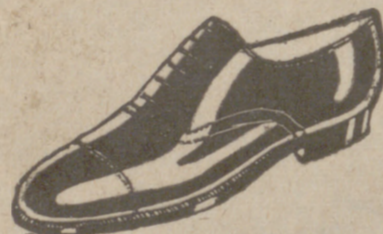
Zapatos en cinco colores distintos a 18 pesetas Zapato Charol, a 19'50

Venta directa del Fabricante al consumidor