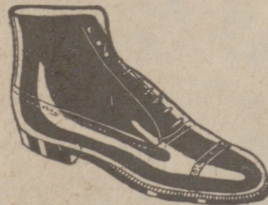
Botas en negro y color todo cosido a 19'50 pesetas