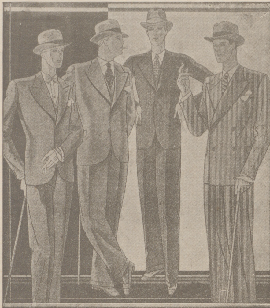
Trajes paño novedad desde 40 a 150 pesetas. — Corte moderno.