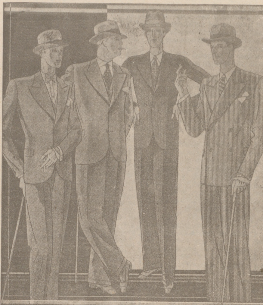
Trejes paño novedad desde 40 a 150 pesetas. — Corte moderno.

El anuncio, siempre por mucho produce ganancias que cueste