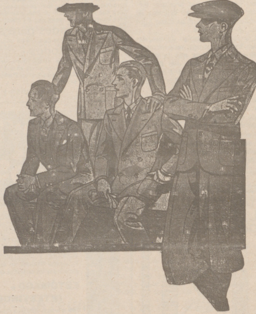
Trajes para juveniles, edad de 10 a 20 años, a 40, 45, 50, 60, y 70 pesetas

Gonzalo Hernando Manrique SUCESOR DE RUFINO S. GONZALO LIBERTO DEL REV. 2, 1 y 6 BURGOS