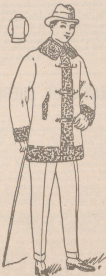
PELLIZAS DE PANO desde 20 a 100 pesetas La casa que más surtido tiene y más barato vende

PLAZA MAYOR, 42 LAIN CALVO 9 Y 11 BURGOS