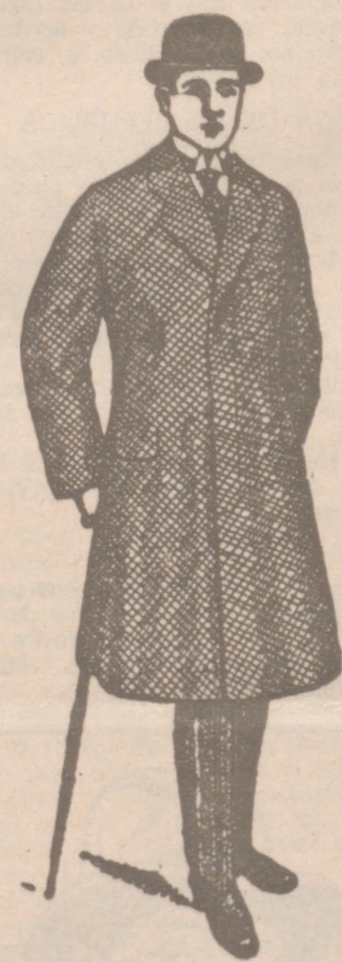
GABANES PARA CABALLERO a 85, 40, 60, 70, 90 y 100 pesetas Lea V. siempre EL CASTELLANO