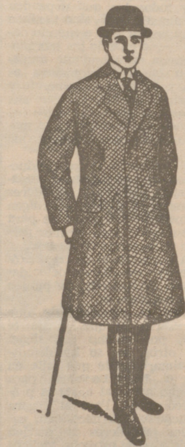
GABANES PARA CABALLERO a 35, 40, 50, 70, 90 y 100 pesetas