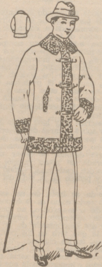
PELLIZAS DE PANO desde 20 a 100 pesetas. La casa que más surtido tiene y más barato vende

PLAZA MAYOR, 42 LAIN CALVO 9 Y 11 BURGOS