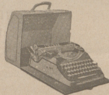
Máquinas de escribir