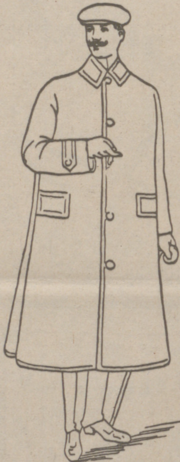
Impermeables negros o color, a 55, 40, 50 y 60 ptas. Trincheras, de 25, 50, 40 y 50 ptas. Pellizas paño, a 20, 25, 50 y 50 ptas. La casa que más surtido presente y más barato vende.

FABRICA DE LIBROS RAYADOS, DIARIOS, MAYORES COPIADORES, ACTAS, ENCUADERNACIONES, ETC CAJAS DE CARTÓN EN GRAN ESCALA Gonzalo Hernando Manrique SUCESOR DE RUFINO S. GONZALO HUBERTO DEL REY, 2, 4 y 6.—BURGOS