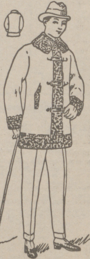
PELLIZAS DE PAÑO desde 20 a 100 pesetas La casa que más surtido tiene y más barato vende