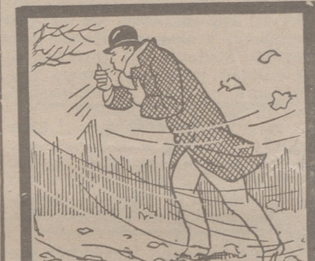
Todos los años, con los primeros fríos, reaparece la tos de Vd. porque tiene sus pulmones debilitados. Fortalezcalos con la SOLUCIÓN PAUTAUBERGE que contiene, a la vez, el antiséptico y el reconstituyente necesarios.

Se acuerda celebrar sesiones por la mañana el miércoles y el jueves; y se levanta la sesión a las nueve de la noche.