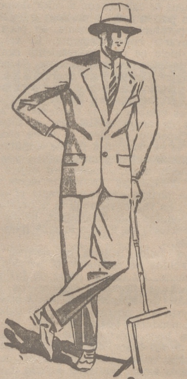
TRAJES DE PANO, CORTE MODERNO de 45 a 150 pesetas

Casa Munguía PLAZA MAYOR, 42 LAIN CALVO 9 y 11 BURGOS