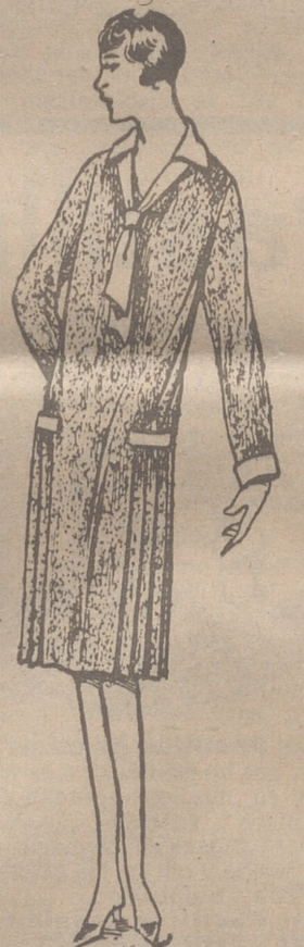
Vestidos de crepón, seda y en lana, colores novedad, a 20, 25, 30 y 40 ptas

Atadoras Krupp de 1'80, 1'50 y 1'20 metros de corte. Recomendamos el tipo ligero especial de 1'20 de corte para dos mulas. Son máquinas excelentes y garantizadas, almacén de maquinaria Feliciano Ortega, antiguas casas «Ahles y Schlayer», Huerto del Rey 17, Burgos.