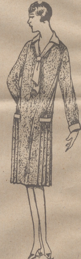
Vestidos de crepón, seda y en lana, colores novedad, a 20, 25, 30 y 40 ptas

Atadoras Krupp de 1'80, 1'50 y 1'20 metros de corte. Recomendamos el tipo ligero especial de 1'20 de corte para dos mulas. Son máquinas excelentes y garantizadas, almacén de maquinaria Feliciano Ortega, antiguas casas «Ahles y Schlayer», Huerto del Rey 17, Burgos.