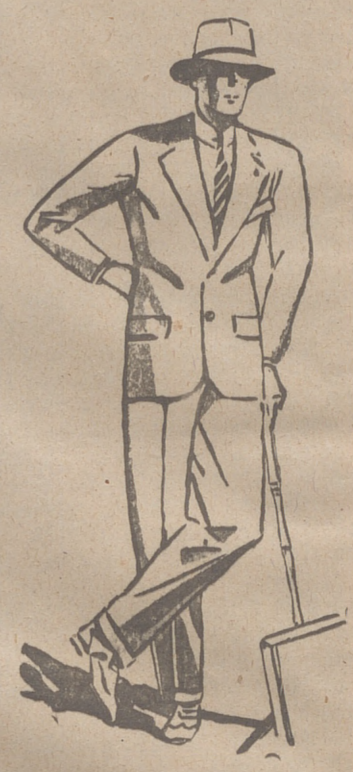
TRAJES DE PANO, CORTE MODERNO de 45 a 150 pesetas

Casa Munguía PLAZA MAYOR, 42 LAIN CALVO 9 Y 11 BURGOS