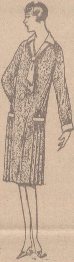
Vestidos de crepón, seda y en lana, colores novedad, a 20, 25, 30 y 40 ptas