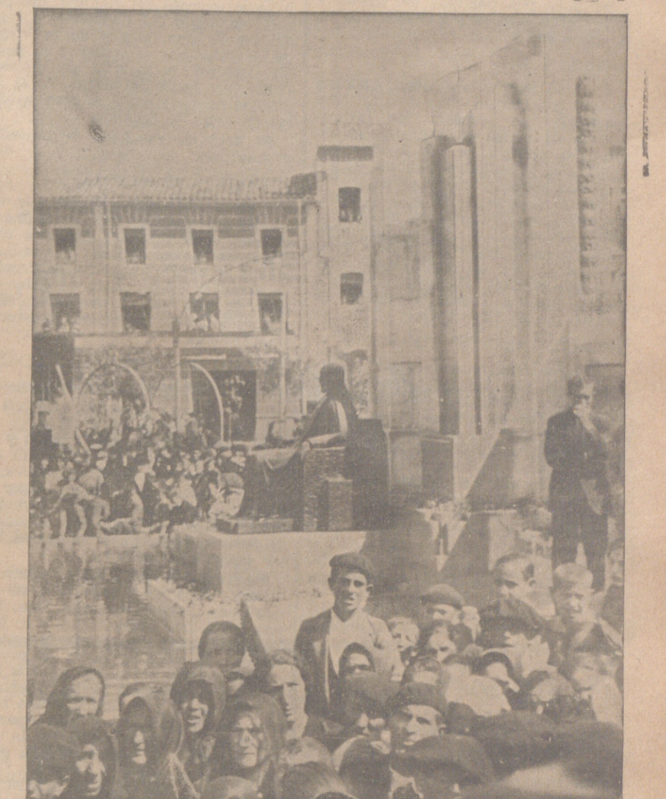
El monumento, momentos después de su inauguración

Asisten el arzobispo de Burgos, el marqués de Alhucemas, el conde de Calleja y otras personalidades.