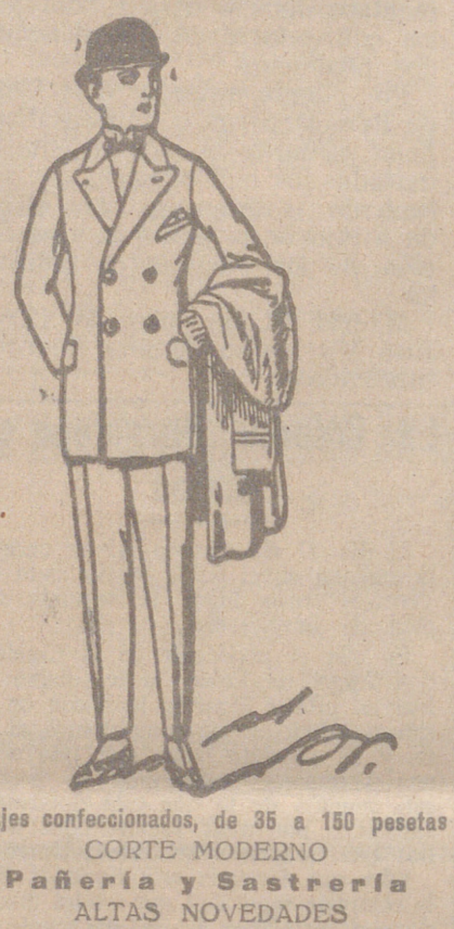
Trajes confeccionados, de 35 a 150 pesetas

PLAZA MAYOR, 42 BURGOS LAIN CALVO 9 Y 11