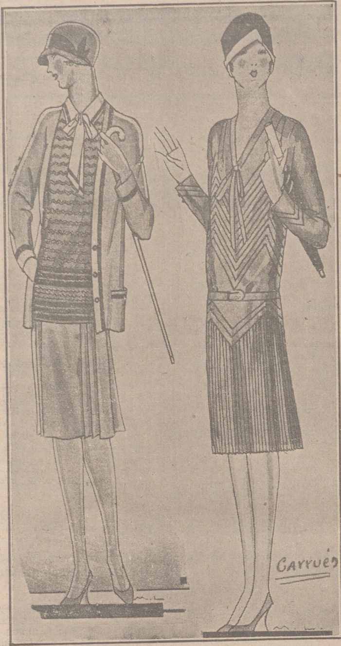
Conjunto tres piezas Swatter tricot fantasía, adornos oro Paletot y falda lana igual color al fondo del Swatter