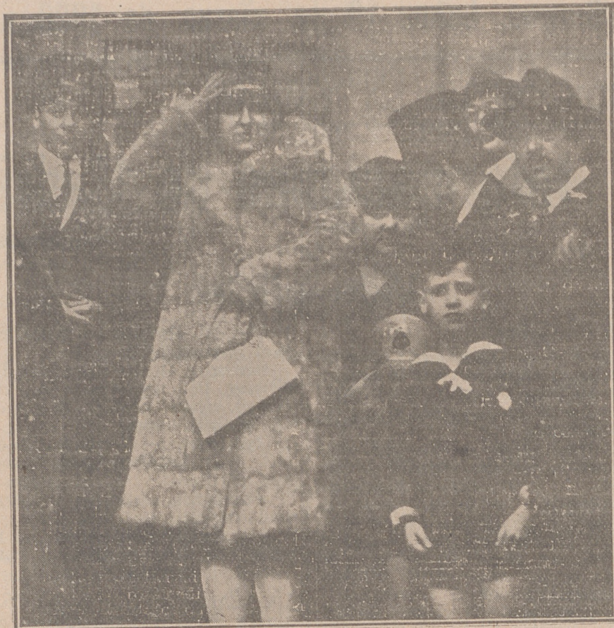
Ofelia Nieto con sus familiares e invitados, saliendo del restaurant Castilla para marchar a Logroño.

La célebre cantante de ópera Ofelia Nieto, contrae matrimonio con don Felipe de Cubas, decano del Colegio de Procuradores de Sevilla.