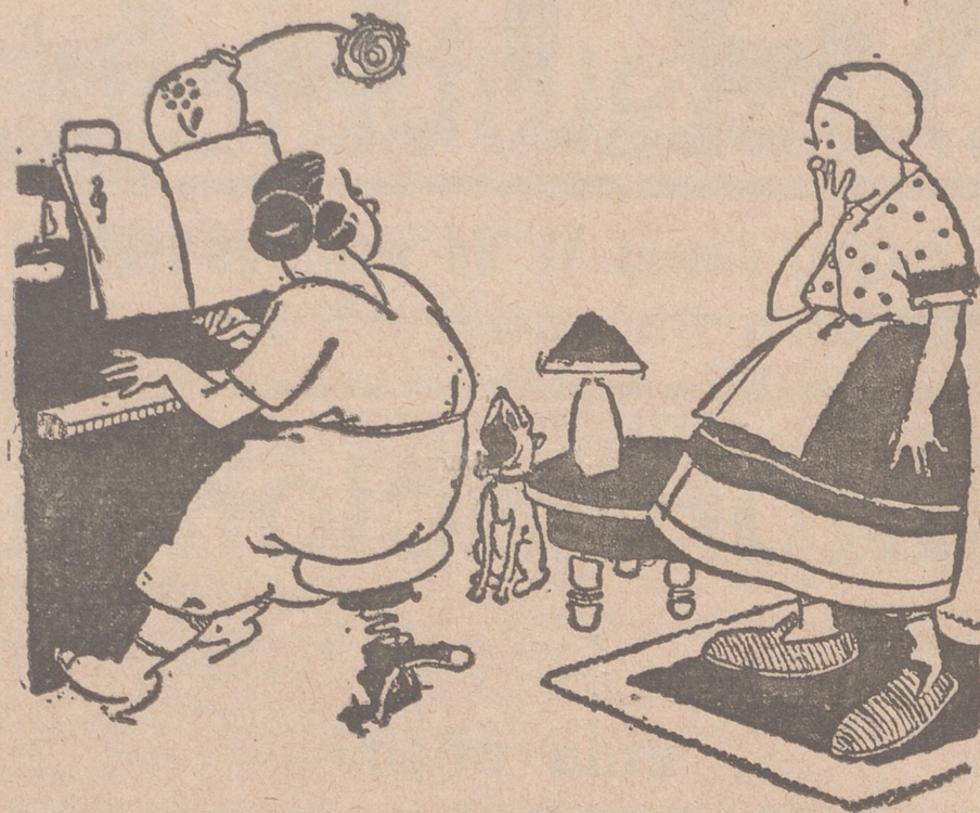
ACERTAR SIN SABERLO

—¿Qué haría V., Nemesia, si tocase el piano como yo? —Aprender, señorita.